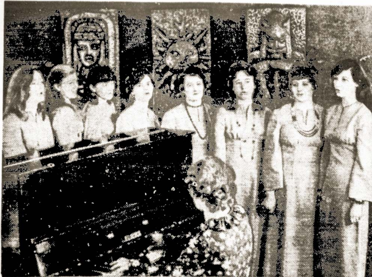
Dainuoja Ukmergės rajono S. Nėries kolūkių moterų ansamblis.