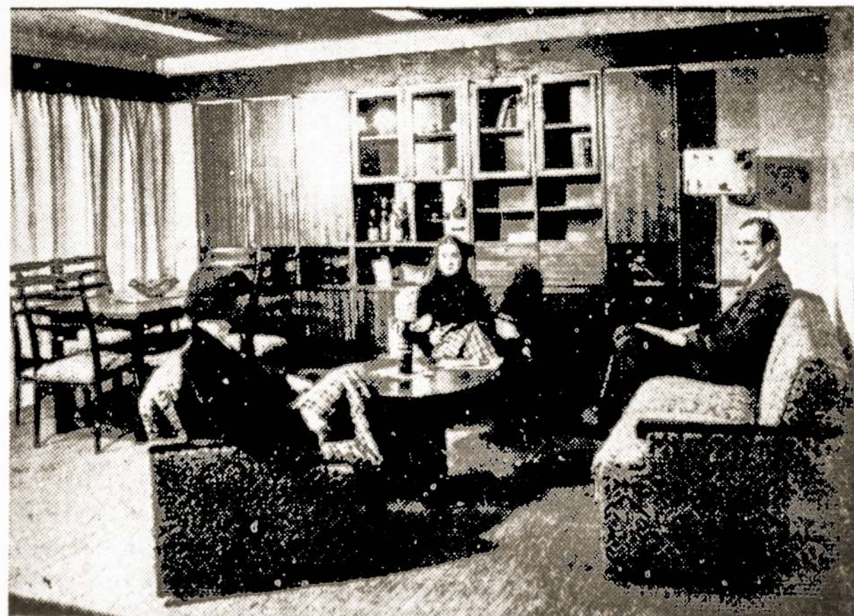
Gražius ir patogius baldus gamina Tarybų šalyje pirmaujantis "Kauno baldų" susivienijimas.