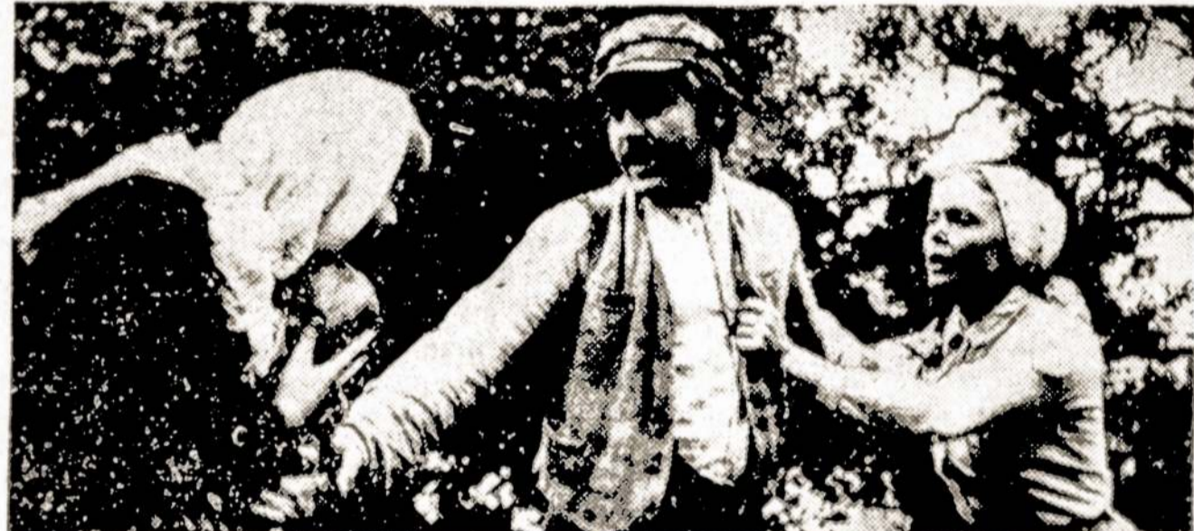
Kadras iš naujo lietuviško filmo "Velnio sėkla".