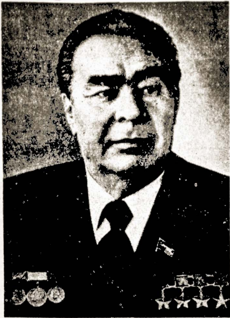
TSKP CK Generalinis Sekretorius, TSRS Aukščiausiosios Tarybos Prezidiumo Pirmininkas L. Brežnevas.

Artinantis Madrido konferencijai dėl Helsinkio susitarimo Baigiamąjo akto ir ryšium su jo 5-osiomis metinėmis, laiško "Pravdos" redakcija paprašė L. Brežnevo, kad atsakytų į pora klausimų, susijusių su tuo Baigiamąjo akto. "Vilnius" skaitytojams pasiskaitė šiuos klausimus ir atsakymus taip, kaip paskelbti Lietuvos spaudoje.