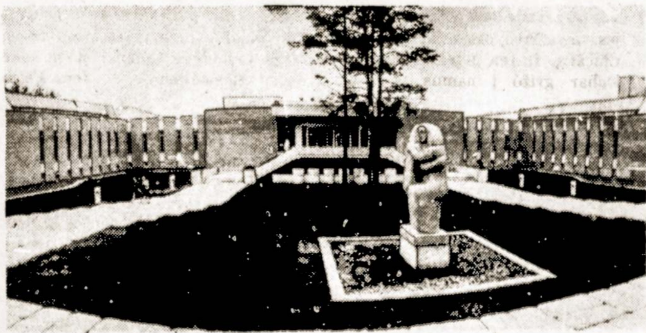
Druskininkų "Eglės" tarpkolūkinėje sanatorijoje pastatytas naujas gydymasis korpusas.

Senoji Kauno pieninė, susigūžusi Nemuno krante palei geležinkelio tiltą, šiandien atrodo kaip nukaršusi senutė. Išties kvartalu čia nusitęsia masyvūs korpusai naujosios pieninės, savo pajėgumais daugiau kaip 7 kartus viršijančios senąją. Nedaug teperdėsime pavadinę ją Pabaltijo pieno pramonės gigantu.