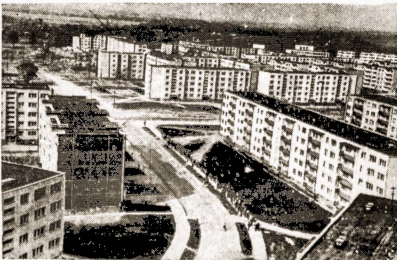
Mažeikių naujųjų kvartalų vaizdas.