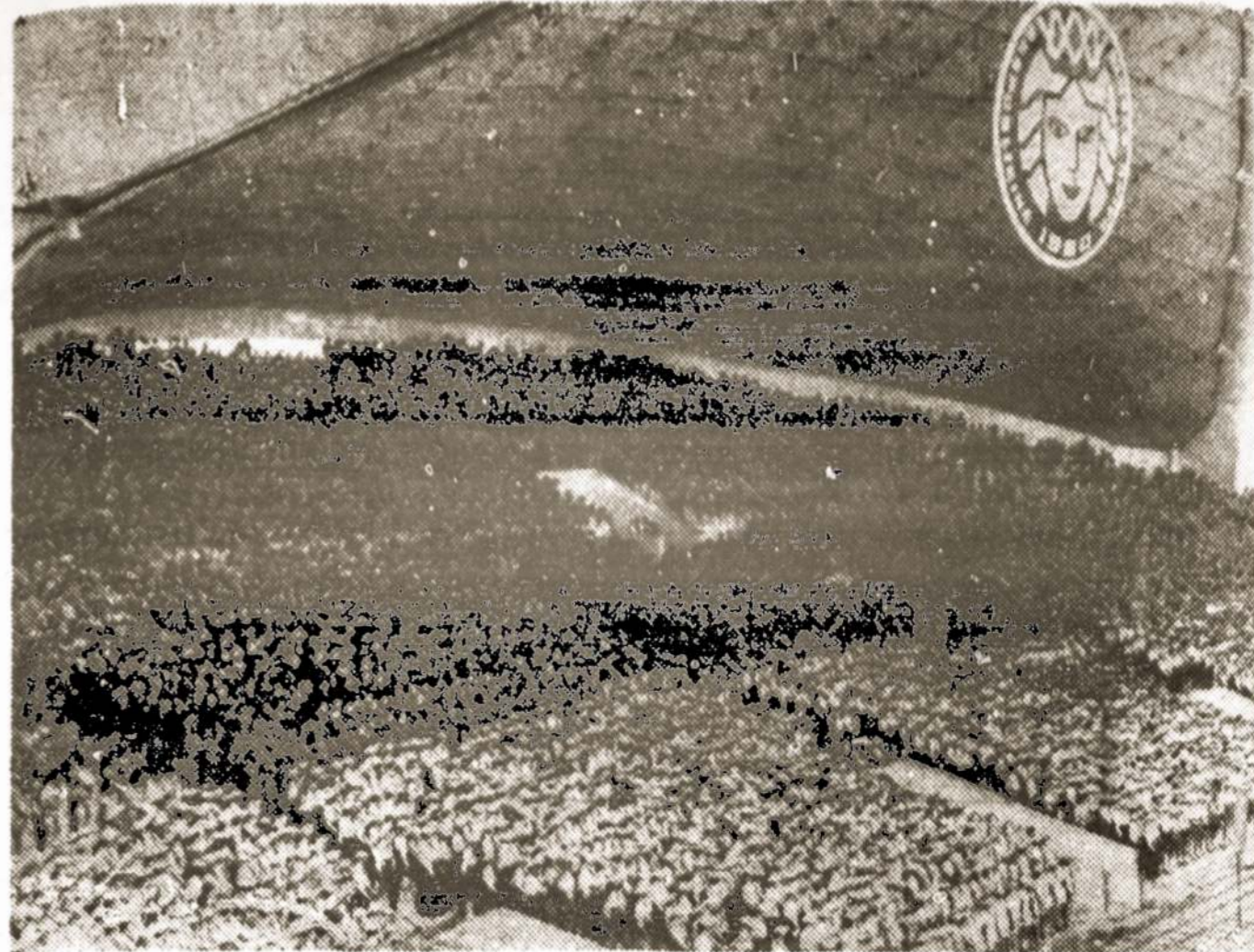
Vingio parko estradoje dainuoja daugiataukstantinis choras.