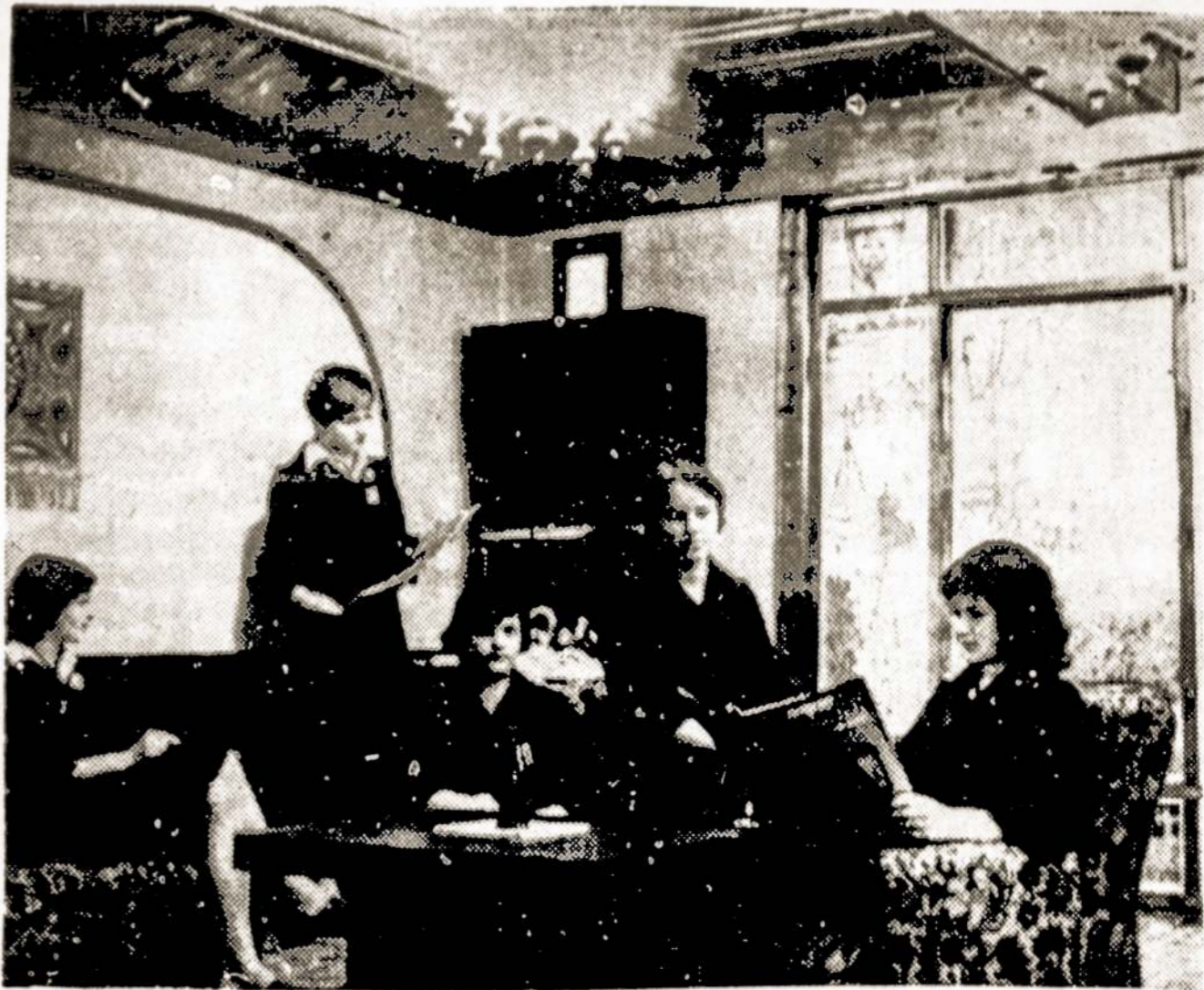
Trakuose atvėrė duris didelė universalinė parduotuvė "Skaistis". Naujoji parduotuvė patogi ne tik pirkėjams, bet ir pardavėjų darbu. Prekybininkams įrengtas jaukus poilsio kambarys, kuriame laisvalaikiu galima išgerti puodelį kavos, paskaityti laikraščius, žurnalus.

Kauniečių pieno gaminiai garsėja ne tik šalyje, bet ir tarptautinėse pieno produktų parodose Leipcige, Poznanėje, Zagrebe, Kopenhagoje, Santjage ir kitur. I. Jasilionis