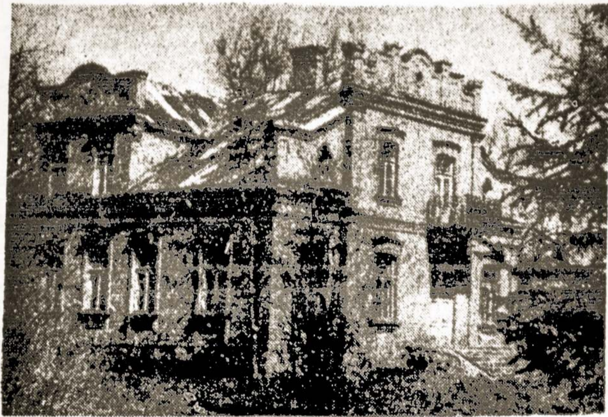
G. Petkevičaitės-Bitės gimtinė. Gyvenamasis namas.

Apsuptame miškų Puziniškio dvarelyje (buvusiame Rozalimo valsčiuje, Panevėžio apskrityje) 1861 m. gimė ir ilgą laiką gyveno rašytoja, kultūros ir visuomenės veikėja Gabrielė Petkevičaitė-Bitė.