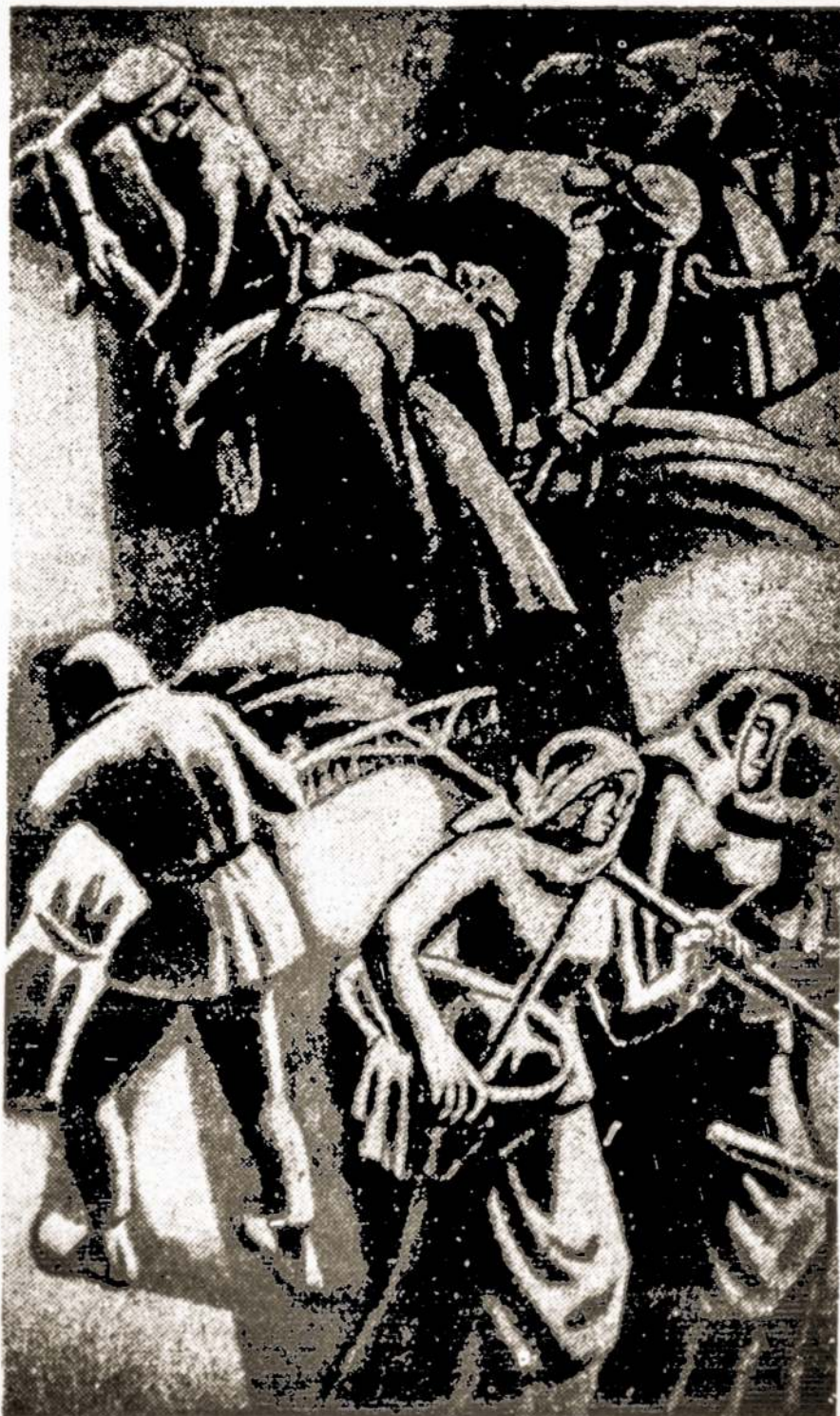
V. Valiaus freskos fragmentas.

kolūkiečių važinėja po tolimas šalis. Štai šiemet 8 gamybos pirmūnai su keliolapiais lankėsi socialistinėse šalyse. Pagaliau ir į mūsų ūkio kultūros namus dažnai atvažiuoja meno žmonės iš Vilniaus, kitur.