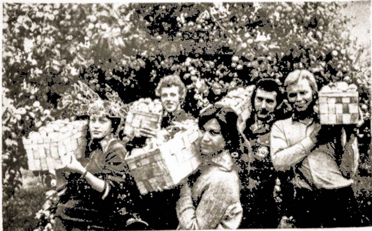
Penkis su puse tūkstančio tonų vaisių šiemet surinko Jurbarko rajono Mičiurino sodininkystės tarybinis ūkis. Nuimti vaisių derlių ūkiui padėjo Kauno Antano Sniečkaus politechnikos instituto studentai. Nuotraukoje: talkininkavę studentai.