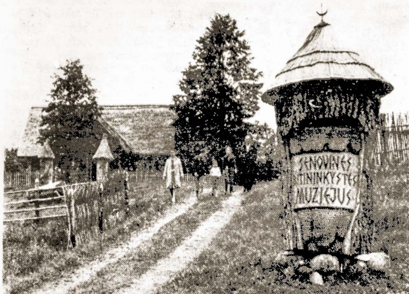
Senovės bitininkystės muziejaus bendras vaizdas.