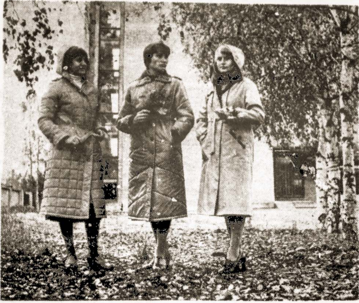
Alytaus "Dainavos" siuvimo fabriko siuvėjų per mėnesį pasiūtais drabužiais galima aprengti apie 20 tūkstančių gyventojų—ir darželinukų, ir suaugusių.

Nuotraukoje: nauji "Dainavos" siuvimo fabriko gaminiai.