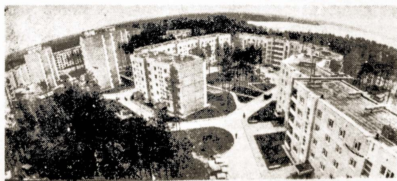
Nuotraukoje: Snieckaus miesto panorama.

Tarp populiariausių Lietuvos TSR Liaudies ūkio pasiekimų parodos eksponatų—statomos Ignalinos atominės elektrinės maketas. Šioje stambiausioje respublikoje statybos aikštelėje auga milžinas, kurio turbinos gamins šešis milijonus kilovatų elektros energijos.