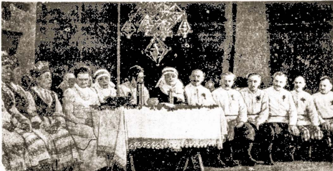
Kupiškio etnografinio liaudies teatro spektaklis.

Tarybų valdžios metais suklestėjo mūsų gimtasis kraštas. Pasiekta svarių liaudies ūkio, mokslo, kultūros laimėjimų. Ryškūs pasiekimai įvyko kiekvieno darbo žmogaus gyvenime, Komunistų partija skiria nuolatinį dėmesį jų gerovei, jų dvasiniam tobulėjimui.