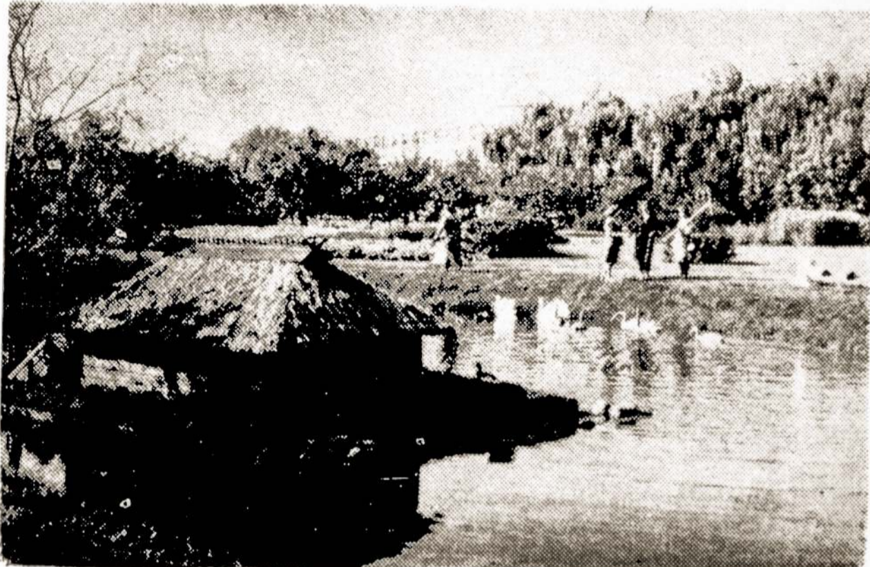
Kapsuko TSRS 50-mečio maisto pramonės automatų gamyklos teritorija. Darbininkų poilsio kampelis.