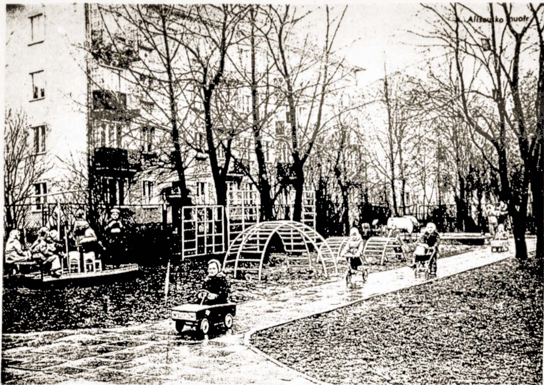
Vienas iš daugelio vaikų darželis-lopselis Lietuvoje.

Šią vasarą Lietuvoje 1,501 įvairaus profilio stovyklose atostogauja daugiau kaip 180 tūkstančių vaikų. Labiausiai yra paplitusios užmiečio pionierių stovyklos, kurios dirba trimis ar keturiomis pamainomis. Pernai jose pabuvojo per 55 tūkstančius vaikų, šiemet šios stovyklos priėmė beveik 57 tūkstančius pionierių ir spalikuų.