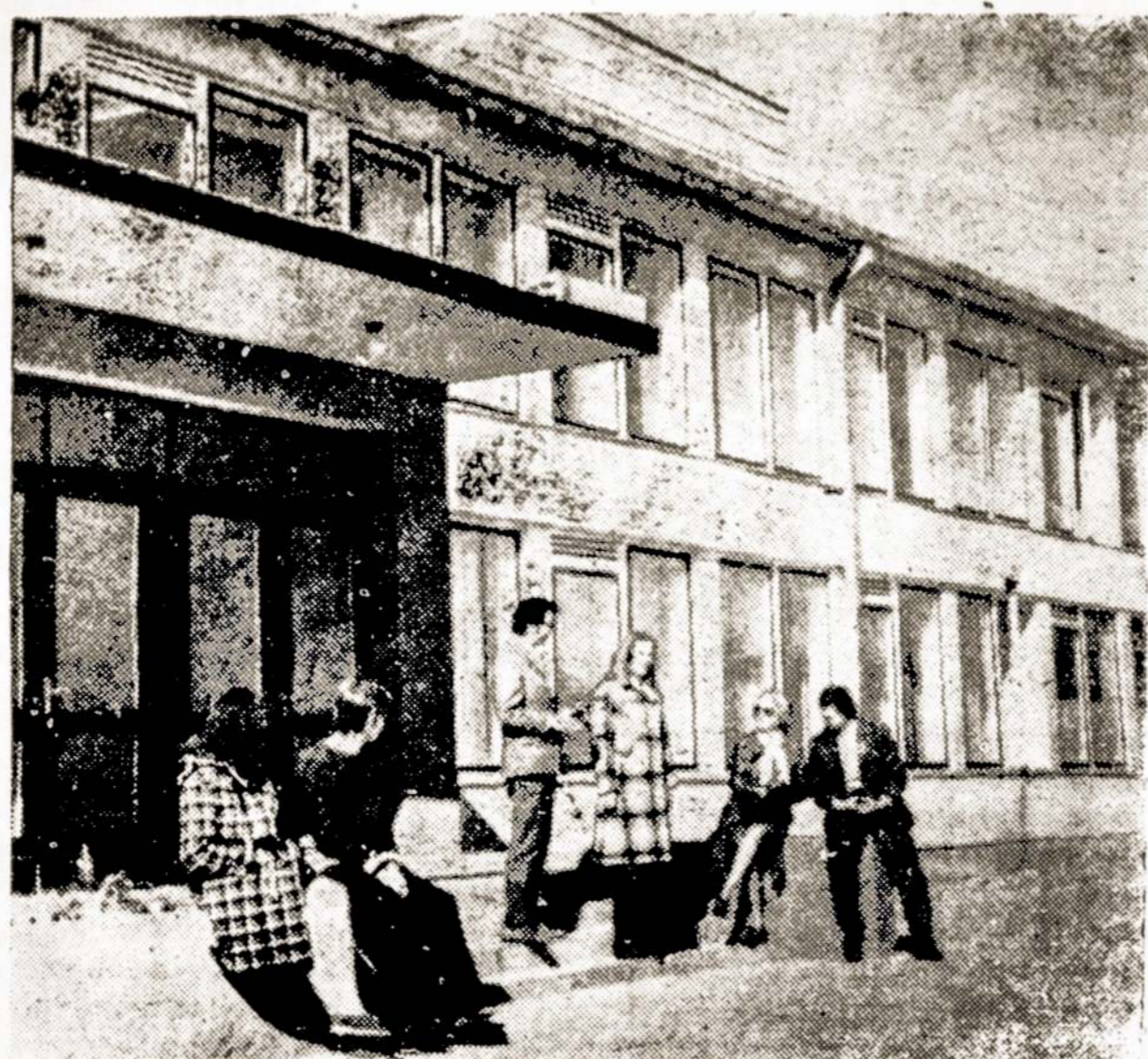
Grupė jaunuolių prie Kultūros namų kaime.

Važiuojant gimtojo krašto keliais, dėmesį patraukia daugelis skoningų užrašų: vienur — tai stambūs laukų rieduliai, kitur — meniškai kalta geležis, dar kitur — stogastulpis primenantys drožinėti ažuolo kamieniai. Visi jie žymi kolūkių arba tarybinių ūkių ribas. Gražu, aišku, įsimintina.