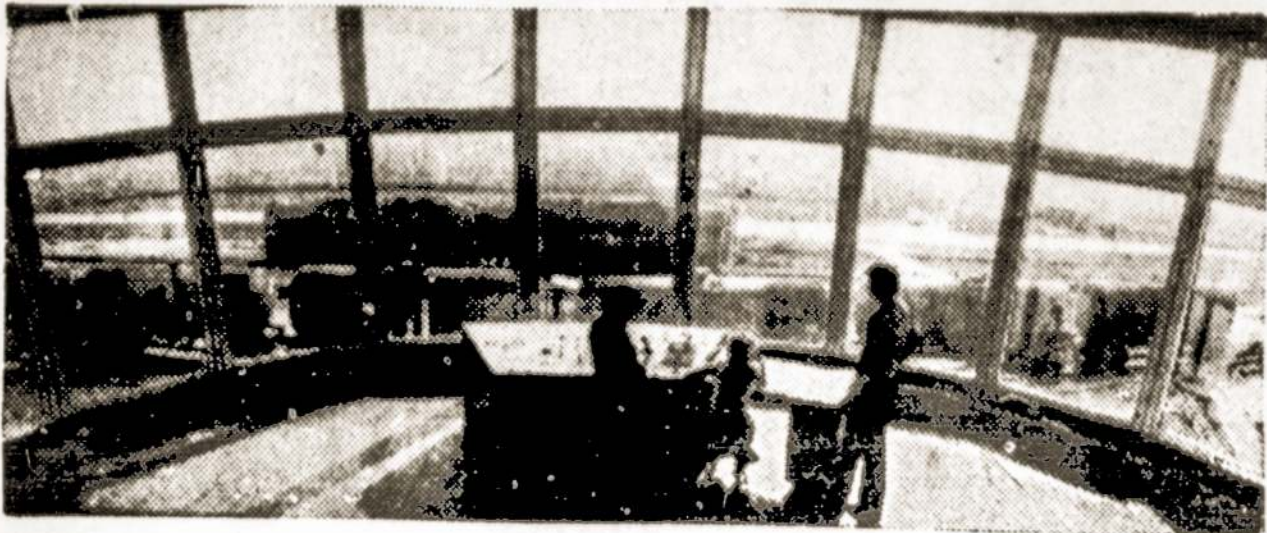
Nuotraukoje: Bugenių geležinkelio stoties centriniame valdymo pulte.

Mažeikių naftos perdirbimo įmonėje stoja rikiuotėn kaskart nauji įrengimai, auga Bugenių geležinkelio stotis, aptarnaujanti šią didžiulę įmonę.