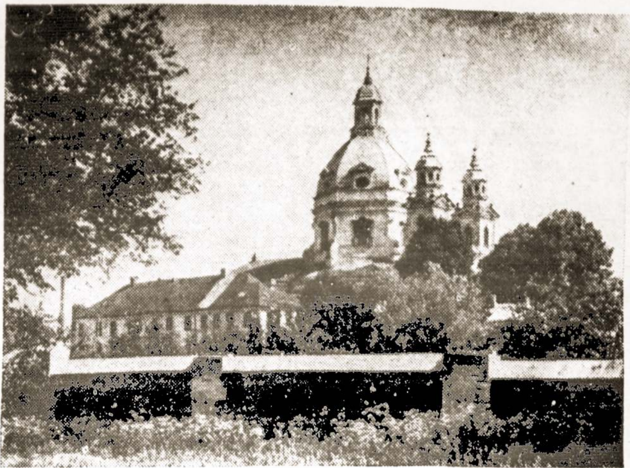
Pažaislio architektūrinio ansamblio bendras vaizdas.

Viena paskutiniųjų naujovių — magistralinių griovių šienapjovė, galinti per valandą nupjauti apie hektarą ploto — beveik dvigubai daugiau, negu naudojamos iki šiol.