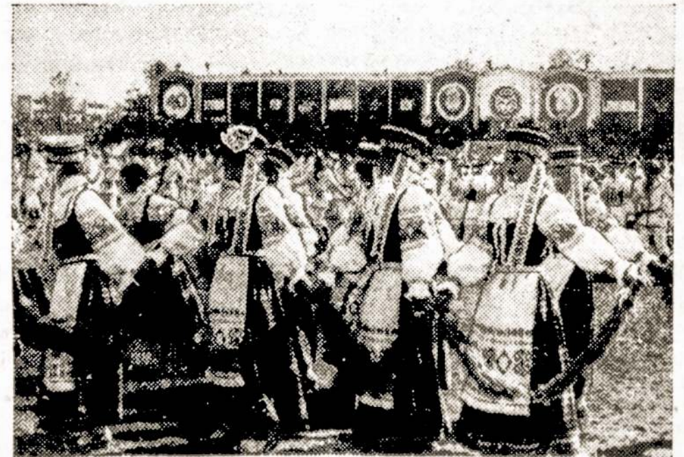
"Žalgirio" stadiono vejoje — merginų šokis.