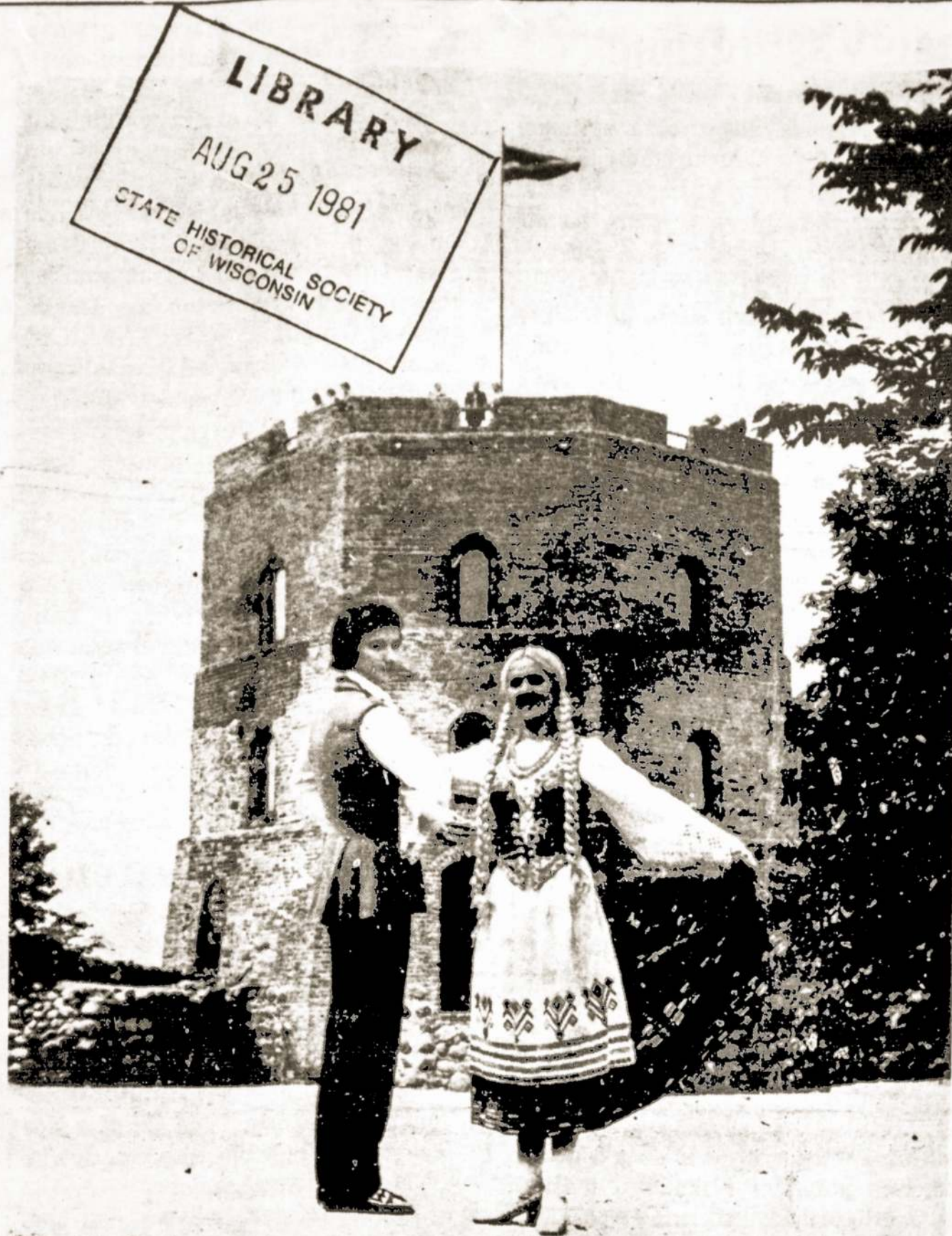
Sename Gedimino mieste, prie Gedimino pilies bokšto.

Tačiau prez. Reaganas ne iš kelmo mestas. Jis žino, kad Social Security pensininkų armija yra virš 36 milijonų žmonių, ir beveik visį jie balsuoja. Todėl nenuostabu, kad anąkart per televiziją prezidentas