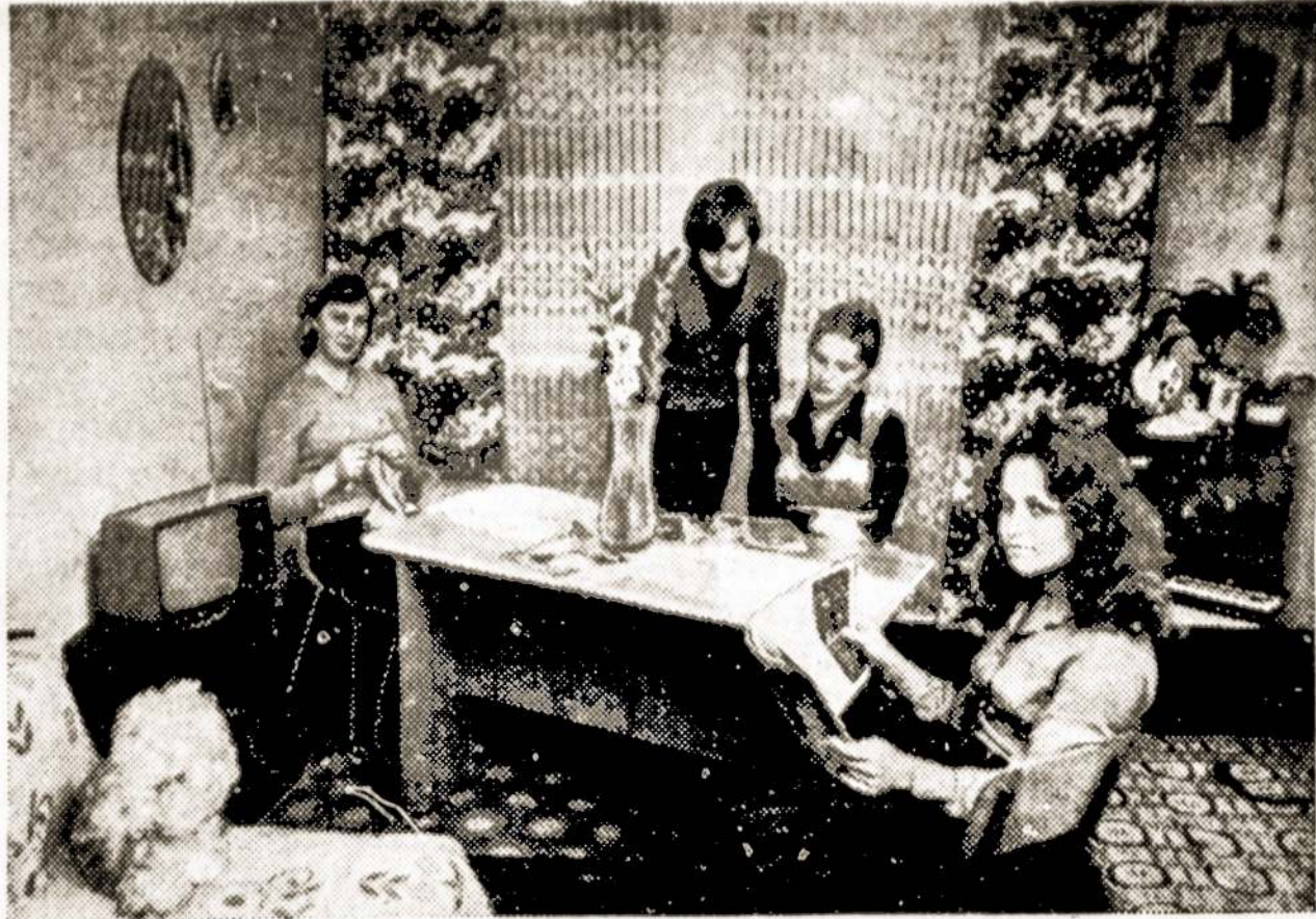
Nuotraukoje: Viename bendrabučio kambarių.

"Čia — ligoninės režimas, žymiai aktyvesnė medicininė priežiūra, —