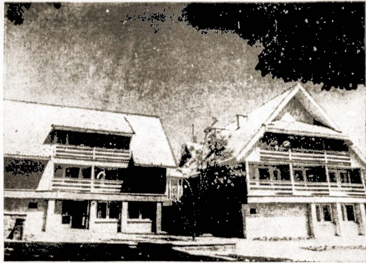
Siame pastate įsikūrė Nidos viešoji biblioteka.

Zarasų vidurinė kaimo profesinė technikos mokykla Nr. 22 Aukštaitijos rajonų ūkiams paruošė 2,991 plataus profilio mechanizatorių. Ši rugsėji mokyklos slenkstį peržengė 230 pirmakursių. Daugumą jų ruošė penkias specializacijas: mechanizatorių, traktorių, traktorių operatorių, traktorių operatorių, traktorių operatorių.