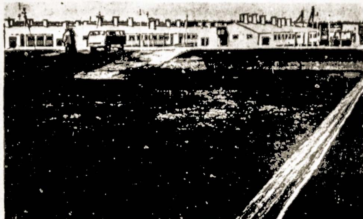
Silutės kiaulininkystės įmonėje mėšlas kaupiamas kapitališkose saugyklose.