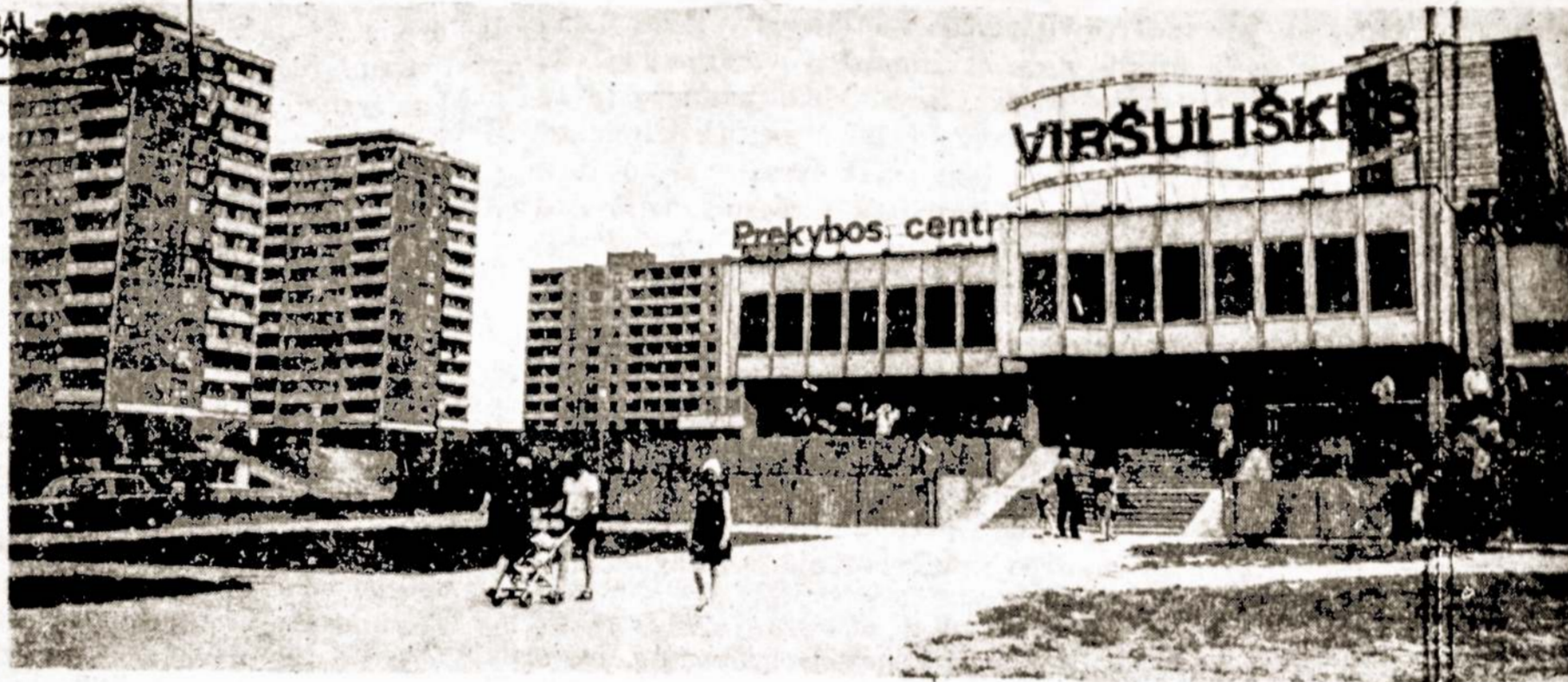
Prekybos centras Viršuliškėse

Svarbus Vilniaus miesto ekonomikos ir kultūros kompleksinio plėtojimo etapas bus vienuoliktasis penkmetis. Šiuo laikotarpiu bus įgyvendintos svarbios priemonės darbo žmonių gerovei toliau kelti, asmenybei visapusiškai ugdyti. Kaip ir ankstesniais laikotarpiais, plačiai bus vykdoma kapitalinė statyba. Nemaža dalis kapitalinių įdėjimų bus skiriama gyvenamųjų namų statybai. Jau trys penkmečiai iš eilės mieste pastatoma apie 1.2 mln. kv. m. bendro gyvenamojo ploto. Ne išimtis bus ir vienuoliktasis penkmetis. Šiuo laikotarpiu bus baigta statyti Seškinės ir, matyt, Justiniškių gyvenamasis rajonas bei atliekami paruošiamieji darbai naujam gyvenamajam rajonui—Pašilaičiams—statyti. Numatoma pradėti užstatyti ir Žalgirio rajoną. Gyvenamieji rajonai bus statomi, kaip ir iki šiol, kompleksiskai—kartu su gyvenamaisiais namais sta-