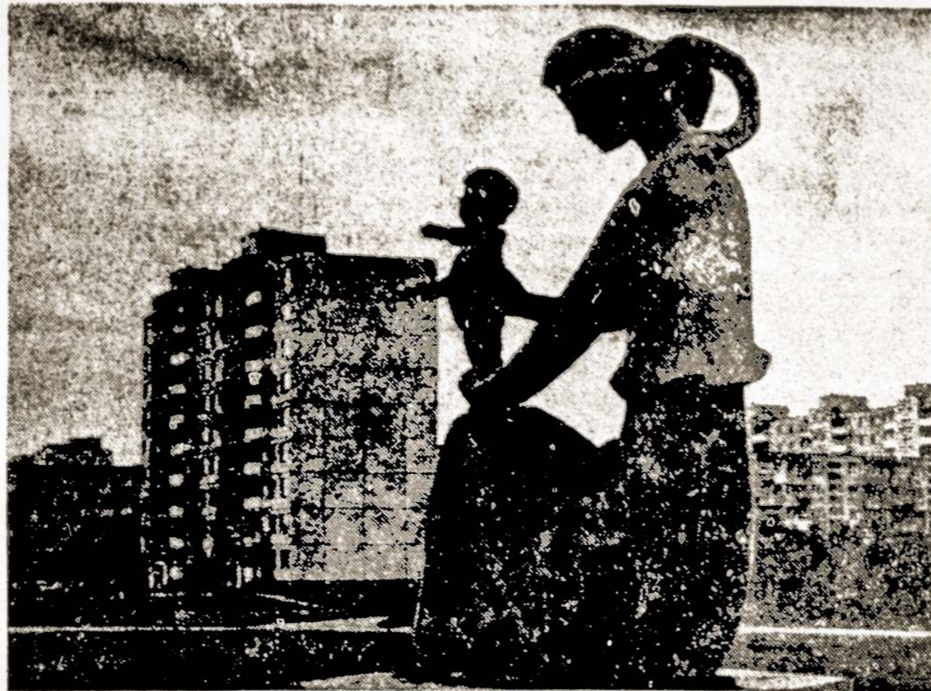
Broniaus Zalenso skulptūra "Svelnumas" Tautų draugystės parke, Kaune.

Darbščiosios kauniečių rankos kasdien deda plytą prie plytos, kelia į viršų Dainavą. Kalniečius, Eigulius, Silainius, kitus gyvenamuosius rajonus. Pažvelkit iš paukščio skrydžio, kai saulė teka: kasryt ji sušvinta vis naujuose languose!