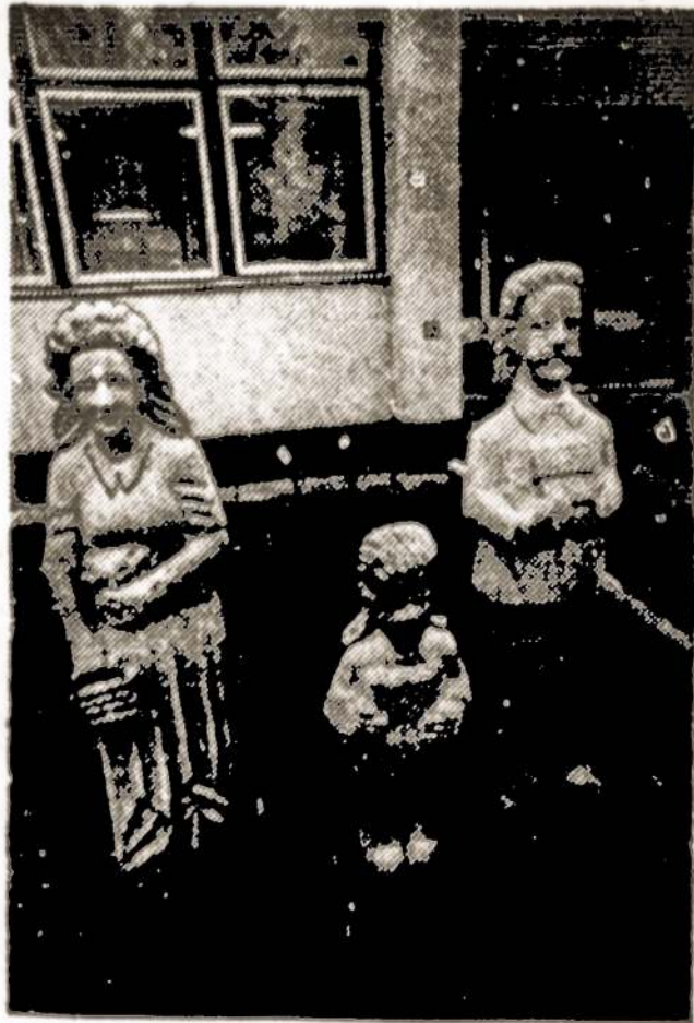
Nuotraukoje: J. Liaudansko skulptūrinė grupė „Knygų mylėtojai“.