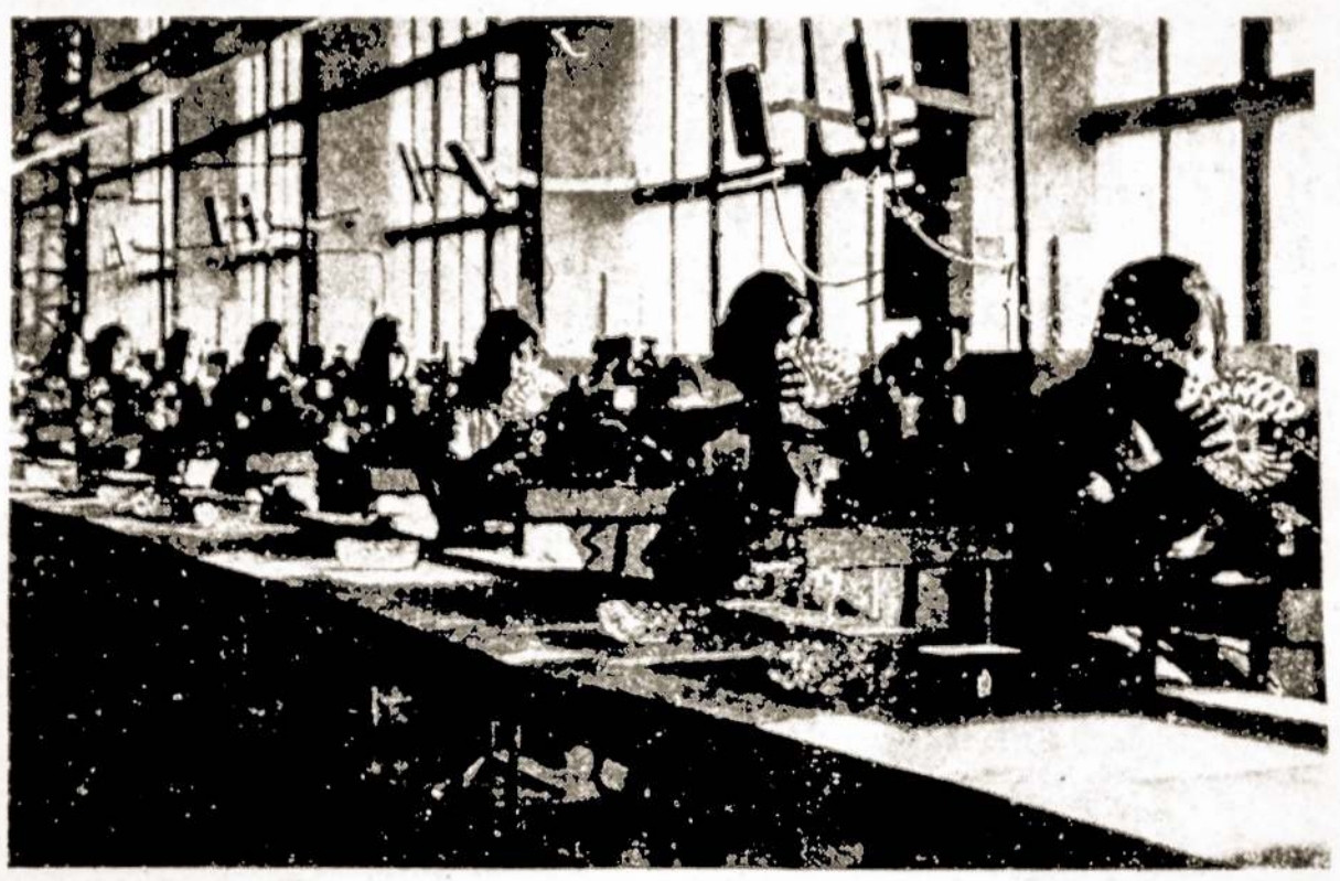
Panevėžio "Ekran" gamyklos krištolo indų graviravimo konvejeris.

Lietuviško krištolo indai su Panevėžio "Ekran" gamyklos ženklu respublikoje ir šalyje pasirodė 1972 m. pabaigoje. Dabar jų pagaminama už milijonus rublių, o produkcijos nomenklatura prašoka penkiasdešimt pavadinimų.