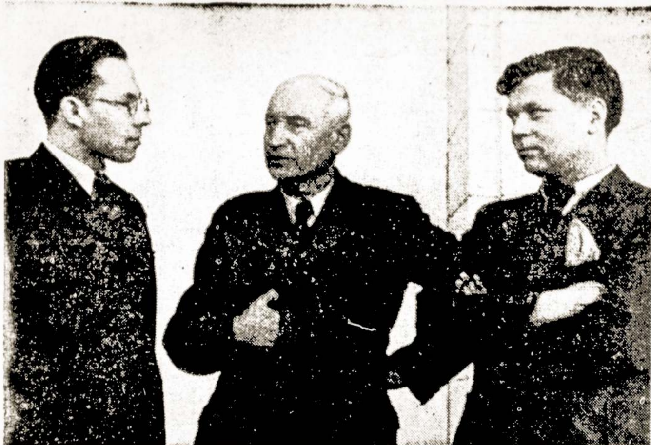
Antanas Vienuolis-Žukauskas kartu su Kostu Korsaku ir Petru Cvirka.

Antano Vienuolio vardas brangus visiems, kam brangi mūsų literatūra, mūsų kultūros istorija, šiandieninis jos suklestėjimas. Tiek savo kūryba, tiek ir pačiu savo gyvenimu, aktyvia visuomenine veikla A. Vienuolis paliko labai gilų, neišdildomą pėdsaką.