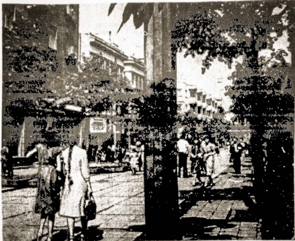
Nuotraukoje: Taip dabar atrodo Vilniaus gatvė Šiauliuose. Ji palikta tik pėstiesiems.

Šiauliai pagal didumą—ketvirtasis Lietuvos miestas, išaugęs Tarybų valdžios metais. Praėjusio karo audrų labai nusiaubtą miestą darbo žmonės prikėlė iš pelenų. Dabar čia veikia daugiau kaip 30 stambių pramonės įmonių. Išaugo nauji gyvenamųjų namų rajonai. Miestas pasipuošė gražiais prekybos, kultūros-švietimo, sveikatos apsaugos pastatais.