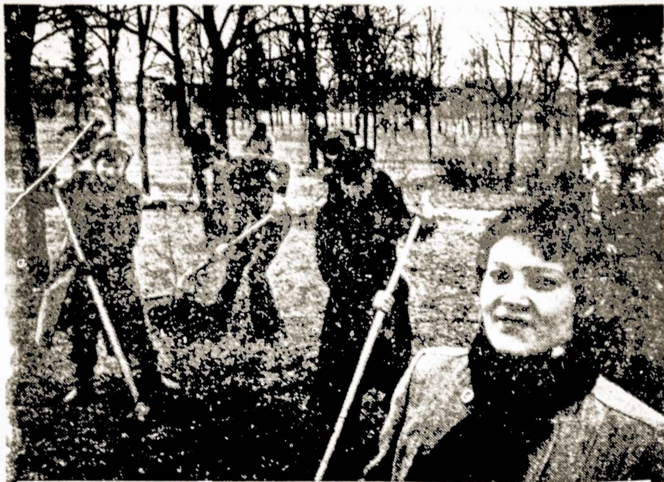
Nuotraukoje: Per Komunistinio darbo šventę Lietuvos gamybinio susivienijimo "Nėris" komjaunuoliai tvarko ir puoselėja parką prie pagrindinės gamyklos.