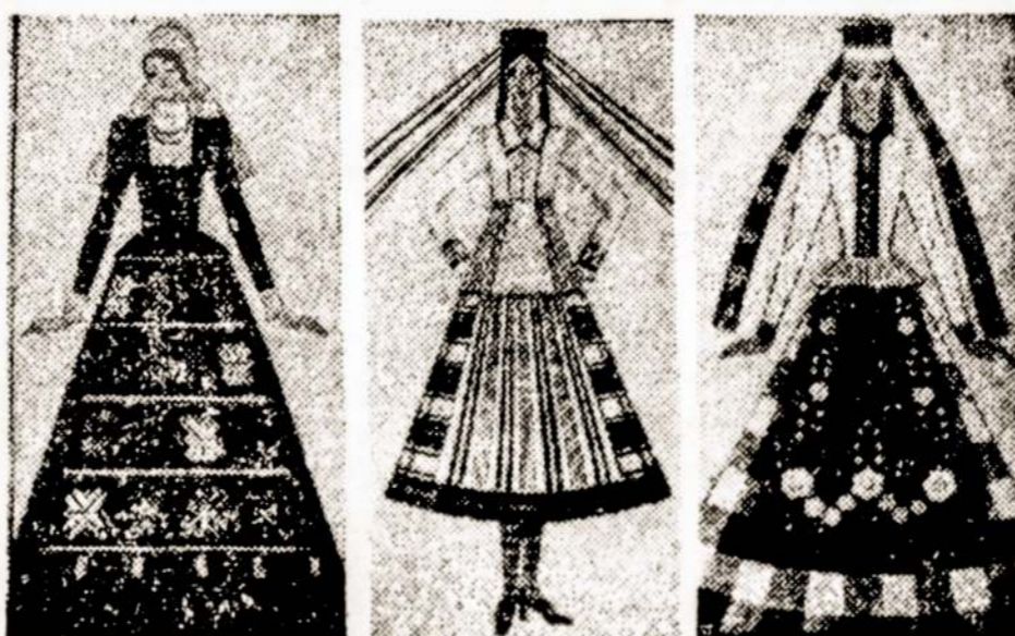
O. ir V. Vincevičių sukurtų kostiumų liaudies šokių kolektyvams piešiniai.

Susirinkę gausybę faktų, pavyzdžių, o svarbiausia, apmąstę pirmosios socialistinės valstybės kūrė-