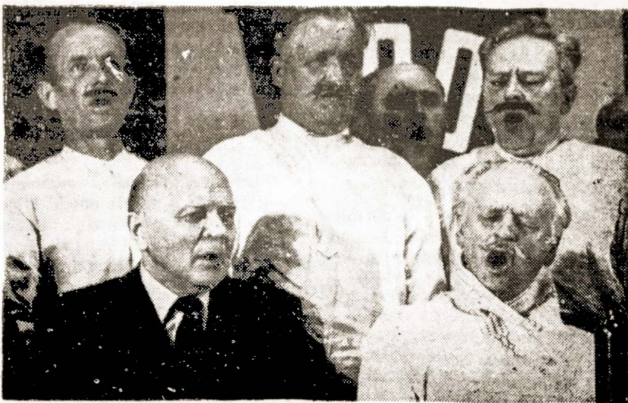
Populiarus visoje Lietuvoje "Kupiškėnų vestuvių" etnografinis liaudies teatras surengė 500-ąjį vaidinimą.

Didžiųjų miestų pakraščiuose "favelų" dar nematyti, kaip matosi Lotynų Amerikos miestų pakraš-