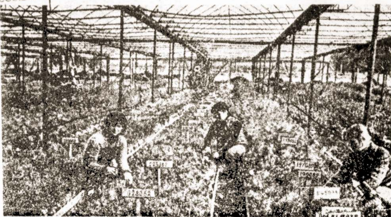
Šiose lysvėse auginami ypač vertingi sodinukai.

Mūsų prez. Reaganas susiriesdamas įrodinėja tautai, kad netrukus