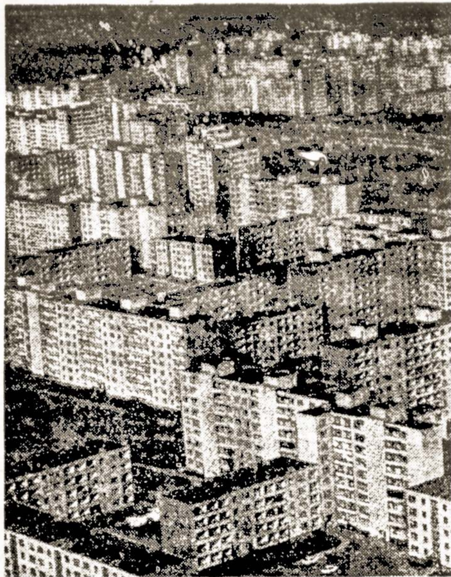
Vilnius šiandien. Lazdynai.

Iš pradžių truputis statistikos: pokario metais Vilniaus teritorija išaugo 2.5 karto, gyventojų skaičius—4.5 karto. Kasdien Vilniuje gimsta vidutiniškai 18-20 vaikų; natūralus prieaugis per metus sudaro apie keturis tūkstančius žmonių, o iš viso gyventojų mieste per metus padaugėja apie 11-12 tūkstančių. Vadinasi, 2000-aisiais metais Vilniuje numatoma apie 700 tūkstančių gyventojų.