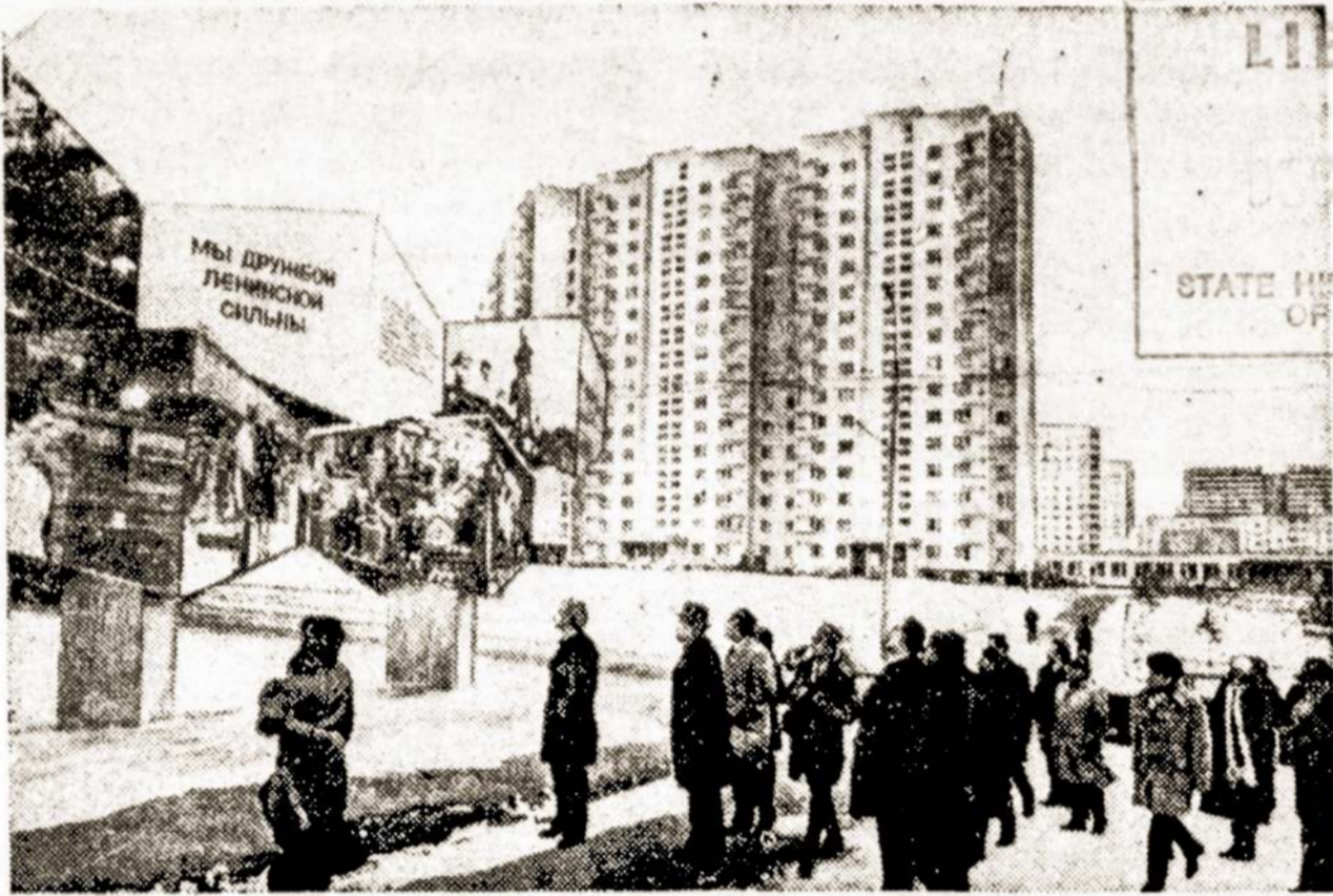
Maskva. Vilniaus gatvė.

Maskvoje, TSRS liaudies ūkio pasiekimų parodos pirmajame tarpžinybiniame paviljone, veikia sąjunginių respublikų jubiliejinė paroda "Vieningoje šeimoje", skirta TSRS 60-mečiui. Paroda pasakoja apie šalies tautų ekonomikos, mokslo ir kultūros laimėjimus. Plačiau susipažinti su atskirų respublikų pasiekimais padeda parodoje rengiamos sąjunginėms respublikoms skirtos dienos. Spalio 18-22 dienomis vyko Tarybų Lietuvos dienos.