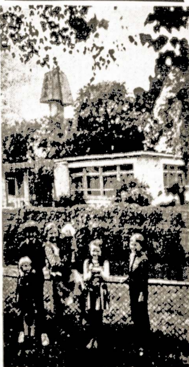
Nuotraukoje: Prie Juknaičių vaikų darželio pastatyta skulptoriaus S. Kuzmos skulptūra "Motinystė".