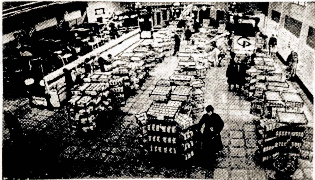
Kauno naujame rajone, TSRS 50-mečio prospekte atidaryta dar viena firminė maisto produktų parduotuvė "Viešnagė". Naujoji parduotuvė tiria prekių paklausą, reklamuoja maisto produktus.

Nuotraukoje: Naujos parduotuvės prekiaavimo salė.