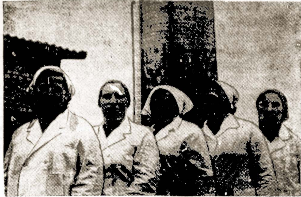
Kėdainių rajono "Tiesos" kolūkis garsėja labai produktyvia karvių banda. Šiomet per pirmuosius tris ketvirčius iš kiekvienos karvės primelžta po 3314 kilogramų pieno.

tinklais apgaudė 20 ežerų, kurių bendras plotas — 1930 ha. 14.5 tonos sužvejojtų žuvų perduota prekybos organizacijoms. Daugiausia realizuota lynų (5373 kg) bei seliavų (3640 kg), toliau sekė karšiai kuojos, karpiai, lydekos, karosai, ežeriai. Kai kur produktyvumas buvo gana didelis. Antai Utenos rajono Giedrio ežere laimikis siekė po 45 kg iš hektaro. Biržų rajono Kilučių ežere — 24. Iki šiol verslinės žūklės įrankiais brigados žvejojo, kuo labiau žiūrėdamos, kad nebūtų pažeisti meškeriotų interesai — buvo saugomos lydekos, karšiai