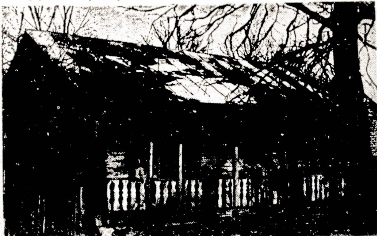
Nuotraukoje: Klėtėlė, kurioje įrengtas Vinco Kudirkos visuomeninis muziejus.

Suvalkijoje yra du Paežeriai. Vieni jų įsikūrę netoli Alvito, kiti— už devynių kilometrų į rytus nuo Vilkaviškio. Į pastaruosius ir užsukome vieną gražią rudens dieną. Rūpėjo sužinoti, kuo šiandien gyvena šių apylinkių žemdirbiai, kaip atrodo Vinco Kudirkos, kitų žymių XIX amžiaus pabaigos rašytojų bei visuomeninių veikėjų gimtinė.