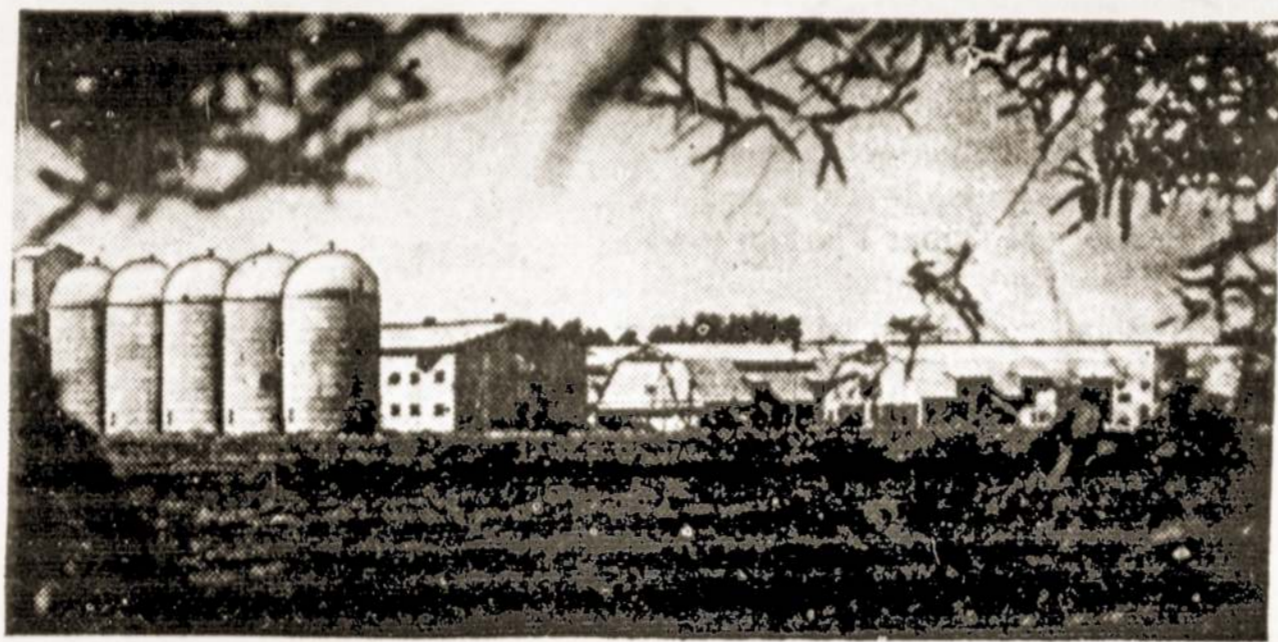
Nuotraukoje: Kapsuko rajono Kapsuko kolūkio gyvulininkystės kompleksas.