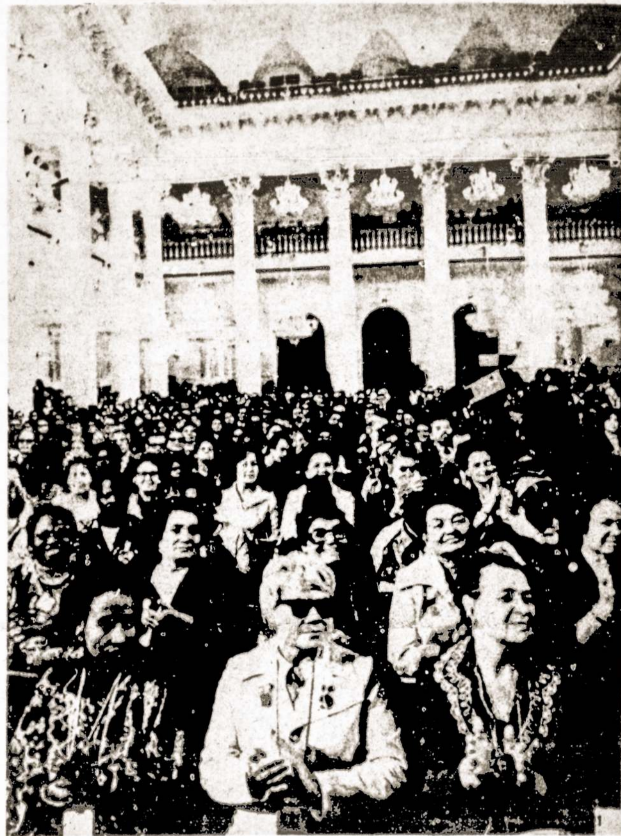
Vienas iš moterų forumų. Šis įvykęs Maskvoje.

Pasaulio moterų svarbiausiu veiksmu kovai už lygias teises, už taiką pasaulyje, už socialinę pažangą ir demokratiją yra Tarptautinė Demokratinių Moterų Federacija, įsikūrusi 1945 m. gruodžio 1 d., įvykusiame pirmame pasaulio moterų kongrese Paryžiuje.