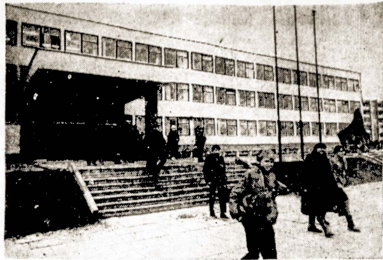
Didelis Aukštakalnio gyvenamasis rajonas pastaraisiais metais išaugo Utenoje. Naujakurių vaikai gavo naują vidurinę mokyklą. Ją lanko daugiau kaip 1200 moksleivių.

Išaugino gražią šeimą: tris sūnus ir visus išmokslino. Visi trys atvažiuodavo aplankyti tėvų, nors visi gyvena toli nuo Floridos.