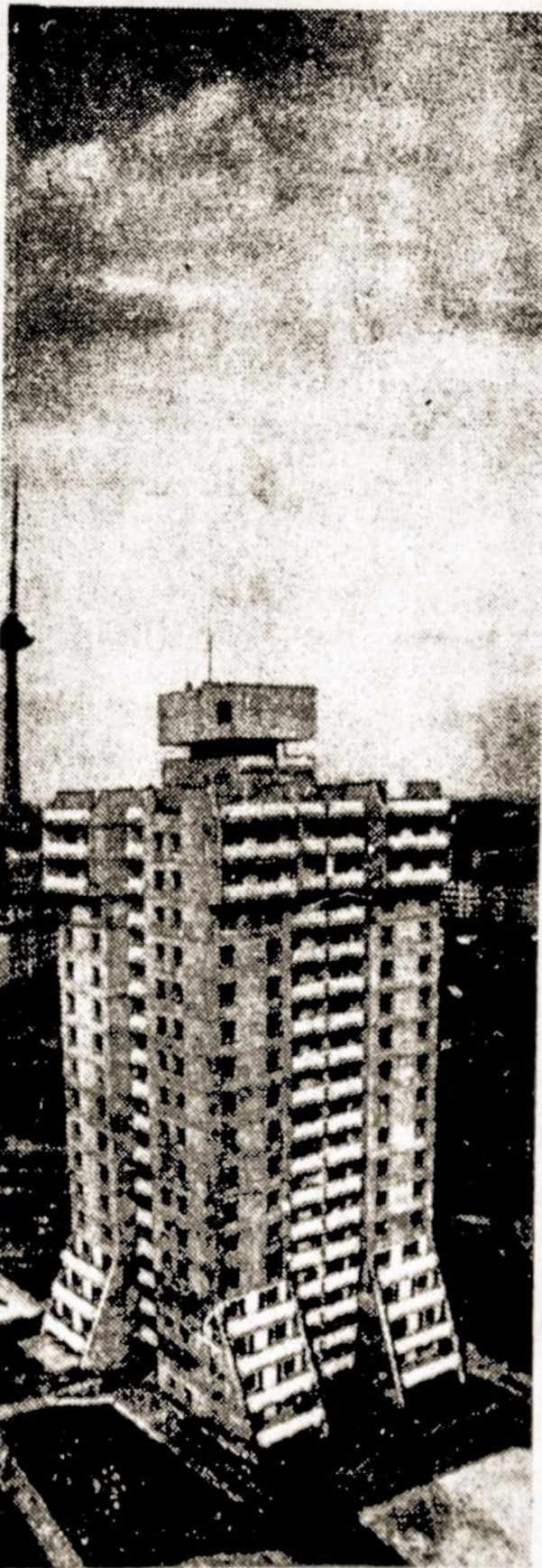
Lazdynų monolitas iš paukščio skrydžio.

Darbštūs valdybos žmonės praėjusiais metais atidavė vilniečiams 10,600 kvadratinų metrų gyvenamojo ploto. Šiais metais iš karto Lazdynuose, Seškinėje, Juztiniškėse jie stato penkis daugiaaukščius. Iki metų pabaigos statybininkai tikisi atiduoti užsakovams 22,200 kvadratinų metrų gyvenamojo ploto.