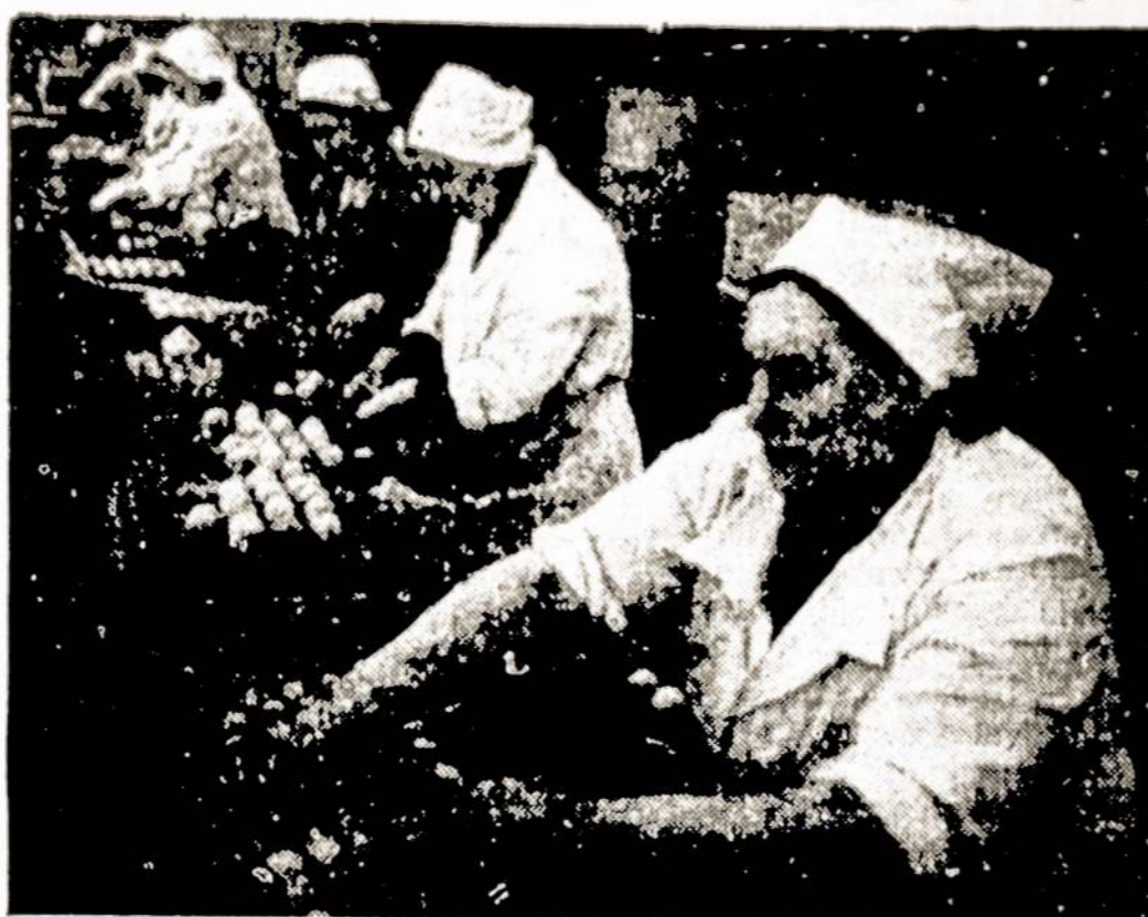
Kiaušinių rūšiavimo bare.

Suskyla kiaušinis, išsiriti viščiukas. Atrodytų, viskas paprasta. O iš tikrųjų nuo kiaušinio iki viščiuko — ilgas kelias. Net čia, moderniaume Vilniaus rajono Juodšilių paukštyno inkubatoriuje.