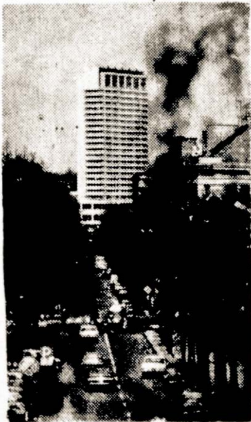
Nuotraukoje: "Lietuvos" viešbutis.

voje. Jis turi 138 tūkstančius kubinių metrų. Viešbutyje yra 327 numeriai, kurių dauguma yra dvie-