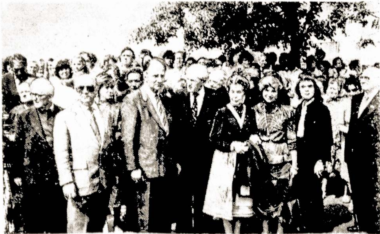
Nuotraukoje: Rokiškyje, prieš išvykstant į Panemunėlį.

13 valanda. Urna su Antano Bimbos palaikais išnešama iš salės. Automobilių virtinė pasuka Panemunėlio kapinių link. Čia prie paminklinio akmens su bronziniu Antano Bimbos bareljefu įvyko gedulo mitingas.