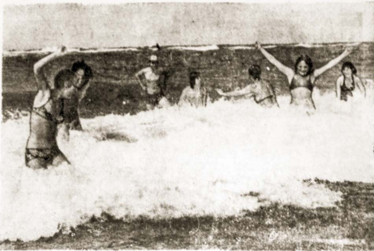
Nuotraukoje: Smagu pasimaudyti jūroje.

Dešimt tūkstančių vaikų šią vasarą praleis prie Baltijos—Girulių pionierių stovyklose.