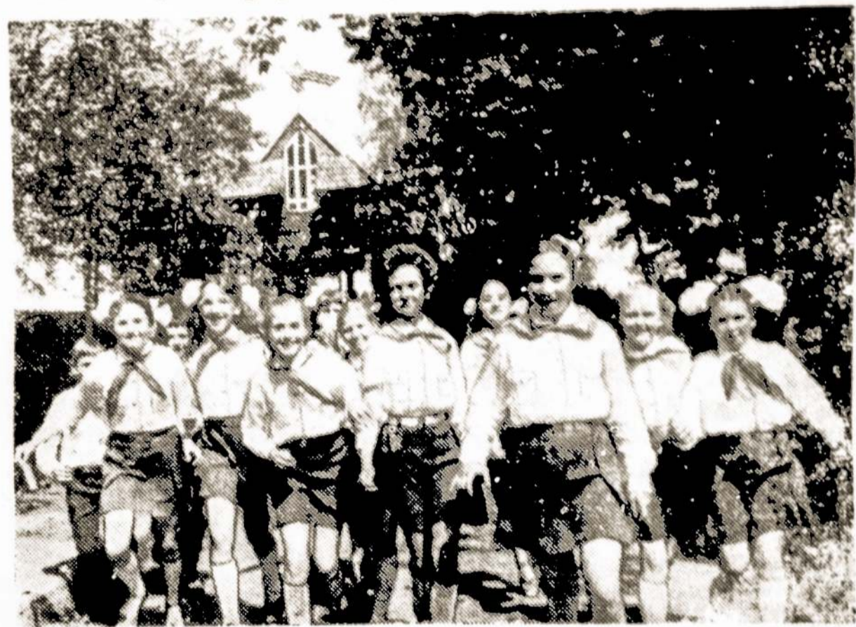
Nuotraukoje: Berniukai ir mergaitės "Pasakos" pionierių stovykloje.