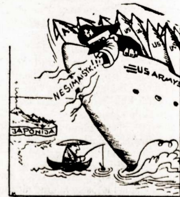
JAV karo laivynas Japonijos uostuose laučias tarsi būtų savo namuose. Igno MARTINAICIO pieš.

— Ilinois valstija per ateinančius penkerius metus išleis $4.6 bilijono vieškelių taisymui ir naujų statymui. Ketina pataisyti valstijoje kaip 900 tiltų ir daugiau kaip 4,200 mylių vieškelių.