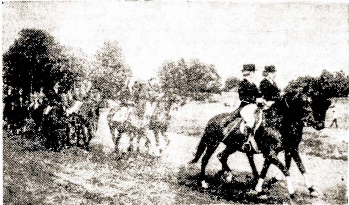
Anykščių rajono Niūronių kaime įvyko tradicinė šventė "Bėk, bėk, žirgeli". Hipodrome žiurovai stebėjo gražaus važiavimo konkursą, raitelių lenktynes, kariatomis važinėjosi Sventosios upės pakrantėmis.

Konkursas baigėsi. Varžovai skirstėsi gerokai pavargę, bet su gera nuotaika. Nuospaudos delnuose be abejo, greitai išnyks, bet gražūs prisiminimai, sukaupia patirtis išliks ilgam. Eglė Bučelytė