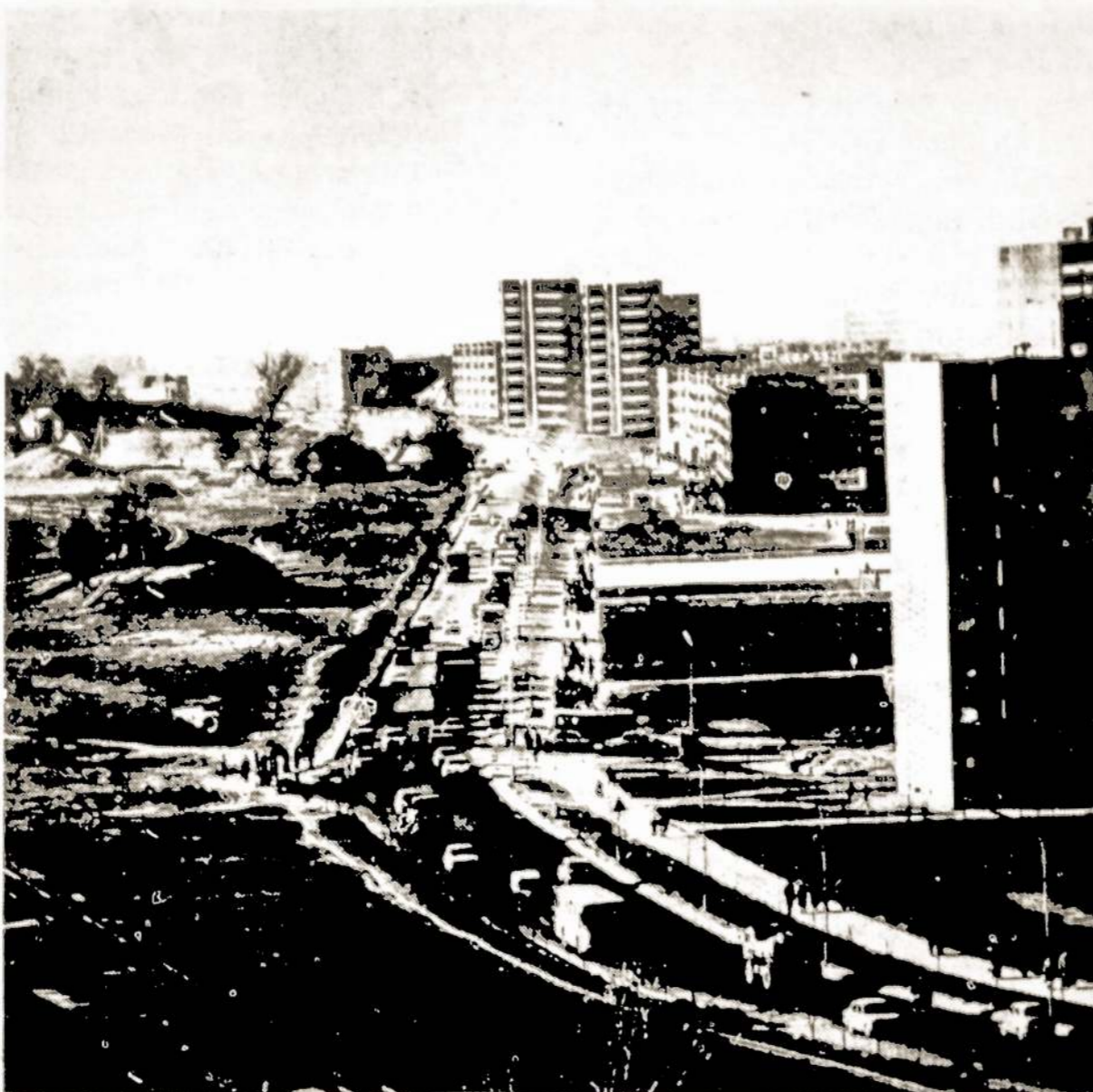
Alytiškiai skuba į darbą—rush hour.

Gražioje vietoje išaugęs Alytus... sraunauš Nemuno vingis, žali pušynai, pramonės milžinų korpusai, daugiaaukščių kvartalai.