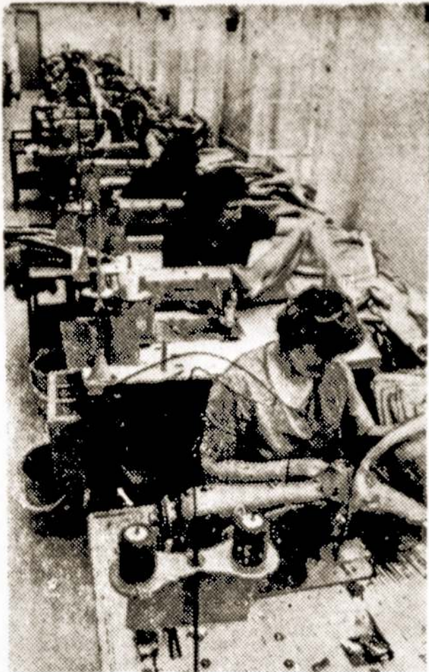
Vilkaviškio siuvimo fabriko kolektyvas per dešimt praeitų metų mėnesių pasiuvo drabužių beveik už dešimt milijonų rublių.

Nuotraukoje: Džinsinių kelnų siuvimo konvejeris.