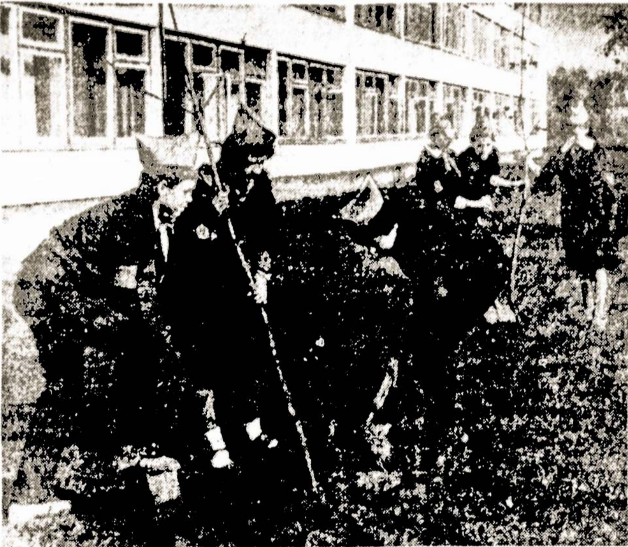
Moksleiviai sodina medelius prie mokyklos.

Rudenį 36-osios vidurinės mokyklos moksleiviai pasodino apie 300 krūmų erškėčių, akacijų, kaštonų, klevų. Lazdynų mikrorajone tvarkė gėlynus prie "Erfurto" prekybos centro.