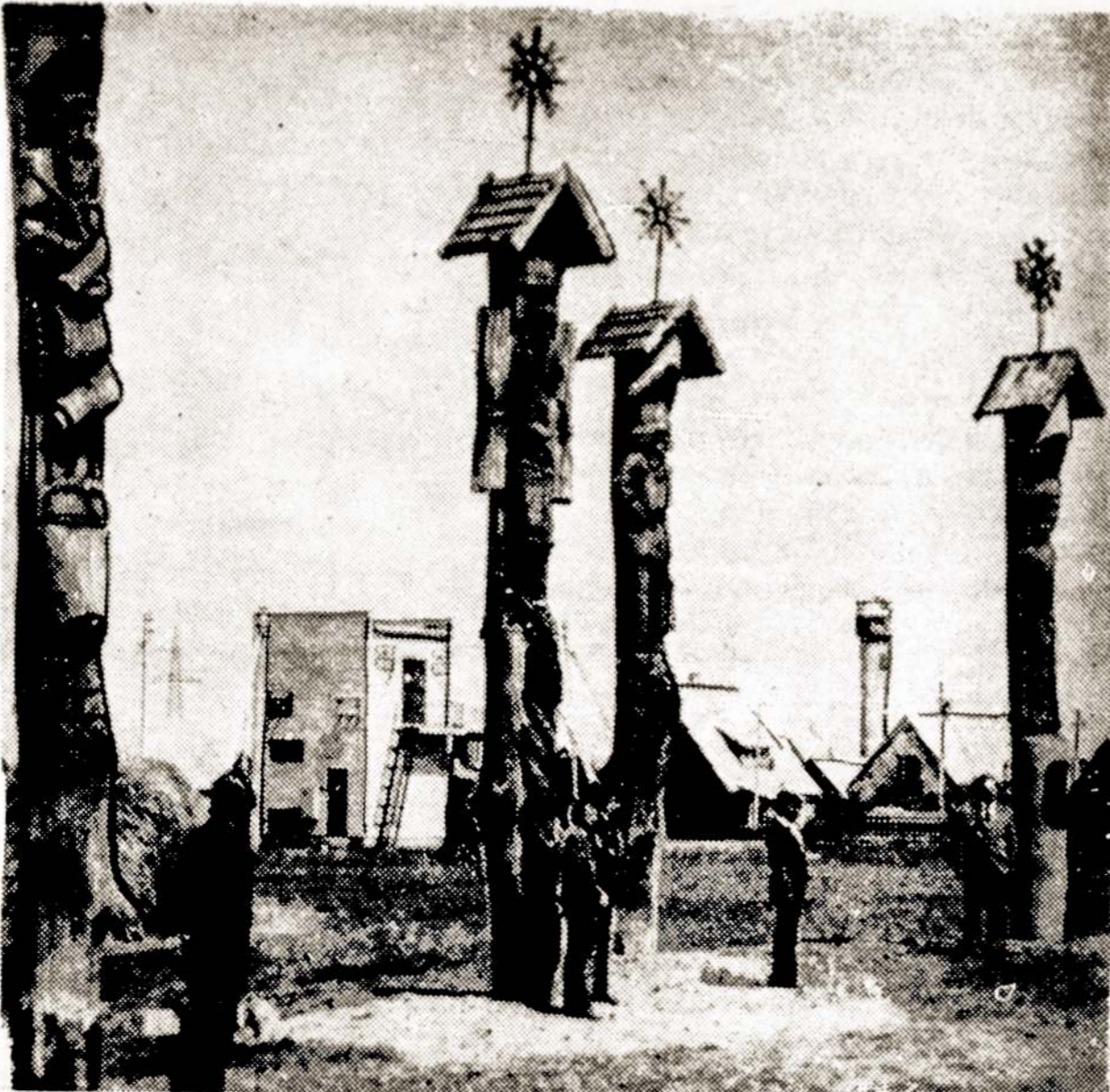
Nuotraukoje: Medžio skulptūros Pasvalio rajono "Mūšos" kolūkyje.