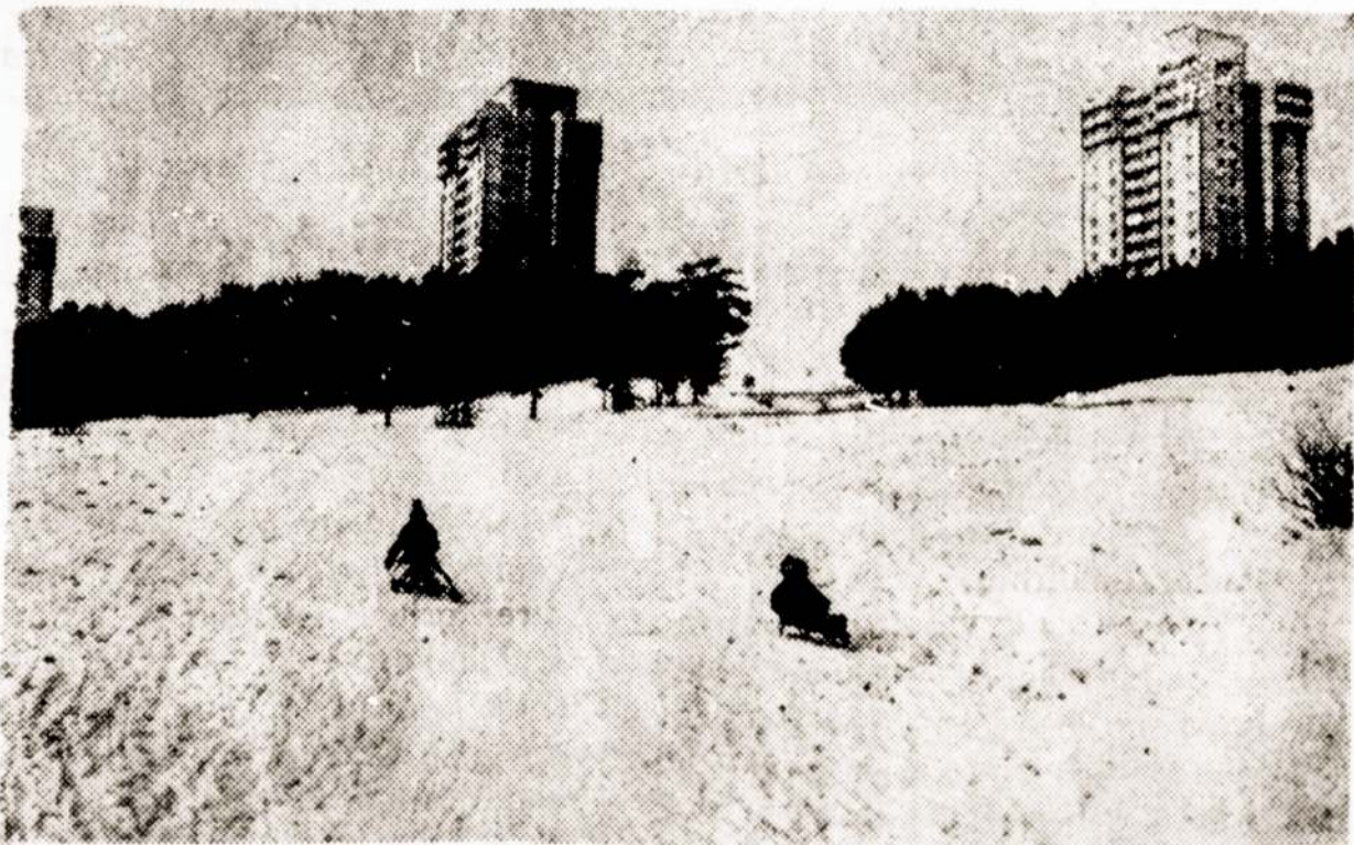
Nuotraukoje: Smagu mažiesiems vilniečiams žiemą pasivažinėti nuo kalnelių prie pat savo namų.