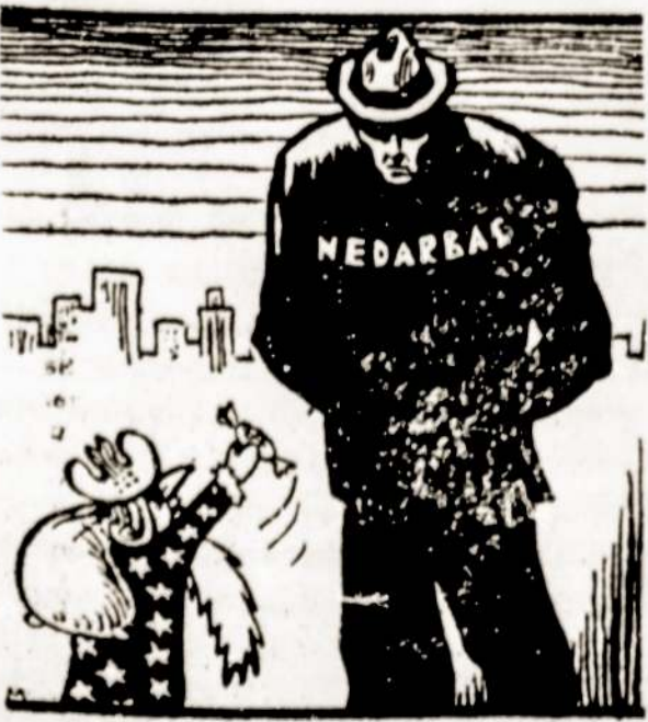
— Sumažėk, nepasiekėk.

— Buvęs prezidentas Jimmy Carteris per Beiruto savaitraštį "Monday Morning" atvirai pasisakė už amerikiečių marinių ištraukimą iš Beiruto.