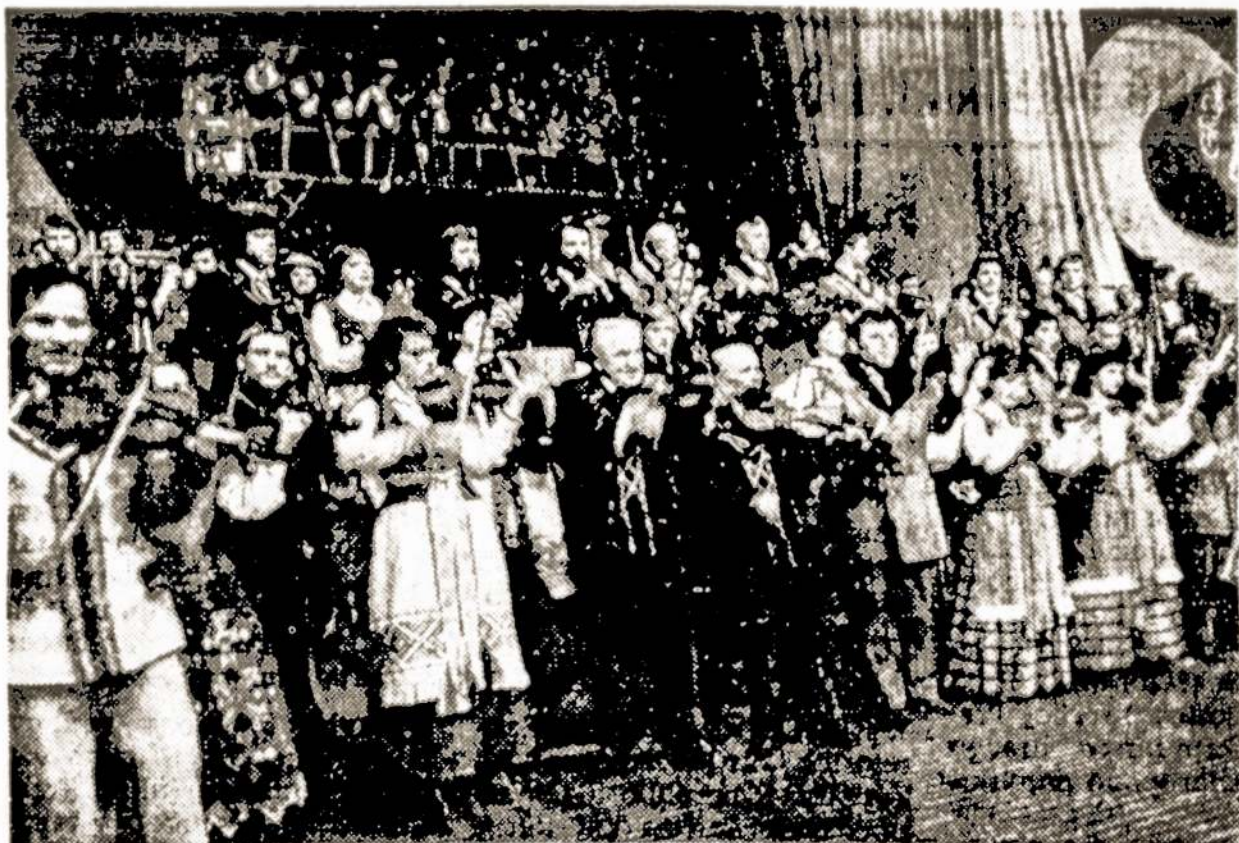
Nuotraukoje: "Grok, Jurgeli" — kaimo kapelių šventė.

Populiarios dabar Tarybų Lietuvoje kaimo kapelos. Jau keturioliktą kartą jos suvažiavo į Kauną parodyti ką sukūrė naujo. Ši savi-veiklininkų šventė vadinasi "Grok, Jurgeli!" Šiais metais iš visų respublikos kampelių suvažiavo 20 kaimo kapelių, su 300 muzikantų, šokėjų ir dainininkų.