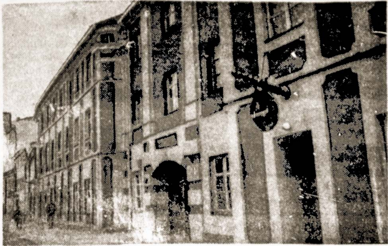
Nuotraukoje: Restauruotos Vilniaus senamiesčio gatvelės vaizdas.