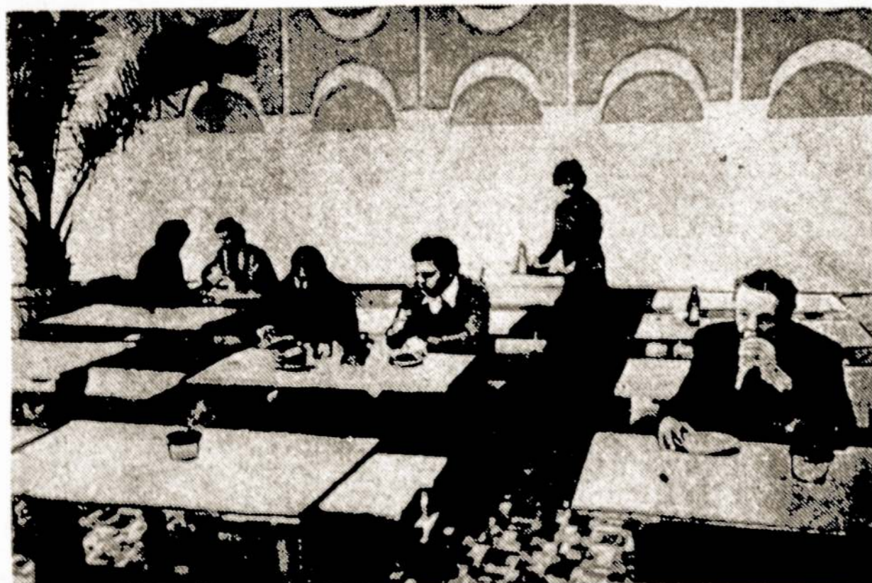
Ukmergės gelžbetoninių konstrukcijų gamyklos dirbantieji gavo naują šimto vietų valgyklą. Netrukus duris atvers ir kulinarijos parduotuvė. Nuotraukoje: Naujoje valgykloje.