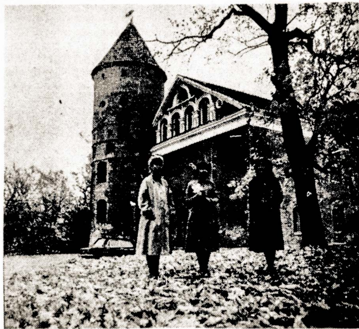
Atstatyta karo metais apgriauta Raudondvario pils, restauruota buvusio oranžerija, arklidės, keletas gyvenamųjų pastatų. Dabar pils atrodo taip, kaip ir XVII amžiuje. Nuotraukoje: Raudondvario pils šiandien.

Ir toliau plėsiame ekspozicijas. Juodkrantėje, kur, beje, XIX a. prasidėjo pramoninė gintaro gamyba, artimiausiu metu planuojame įsteigti muziejaus filialą, parodysime, kaip nuo seniausių laikų vystėsi ir tobulėjo gintaro verslai.