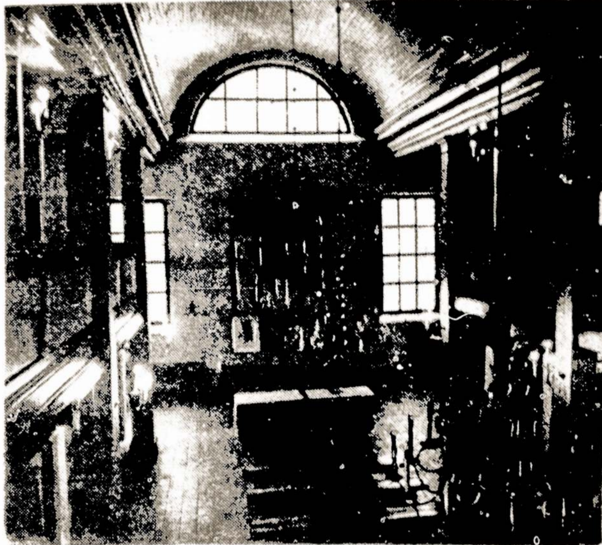
Nuotraukoje: Kristijono Donelaičio memorialinio muziejaus Tolminkiemyje vidus.

Ateinančią vasarą numatoma restauruoti XVIII amžiaus pastatą — buvusią Tolminkiemio parapijos kleboniją, kurioje Kristijonas Donelaitis gyvendamas kūrė "Metus".