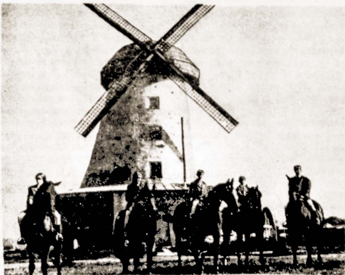
Nuotraukoje: Joniškio rajono Žagarės žirgyno raiteliai.