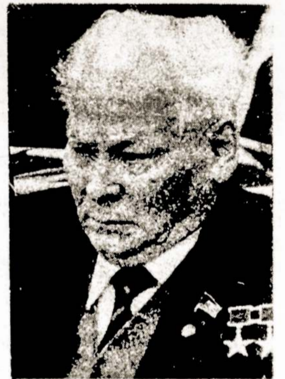
Konstantinas U. Chernenko

K. Chernenko gimė 1911 metais neturtingų valstiečių šeimoje Sibire, Krasnojarsko rajone. Sulaukęs kelių metų neteko motinos, augo našlaičiu. Nuo 12 metų amžiaus, nebaigęs nė mokyklos, pradėjo pelnytis duoną pas turtingesnius valstiečius. 1926 metais įstojo į komjaunimą, siekdamas atliakamu laiku mokslu, dirbo pasieniečiu.