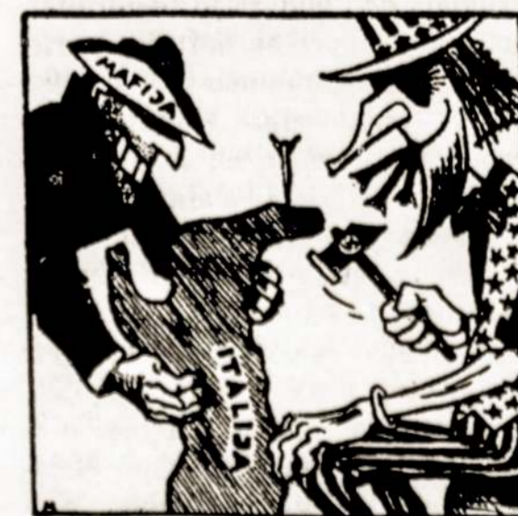
Meistras ir padėjėjas. Ignas Martinaitis pieš. Vilnius, 1984 kovo 1

Italijos mafija tikisi gerokai pasipelnyti iš JAV raketų Europoje. Sicilijoje ji supirko 3500 hektarų žemės rajone, kur bus dislokuotos raketos.