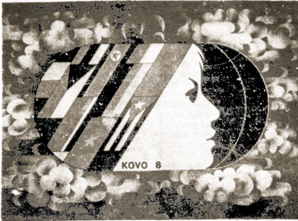
Kovo 8-oji—Tarptautinė moters diena.

N. Kryževičiūtės-Jurgelionienės plakatas