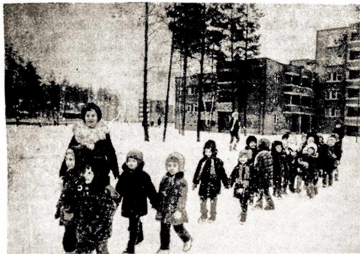
Nuotraukoje: Mažieji Sniečkaus gyventojai darželinukai.