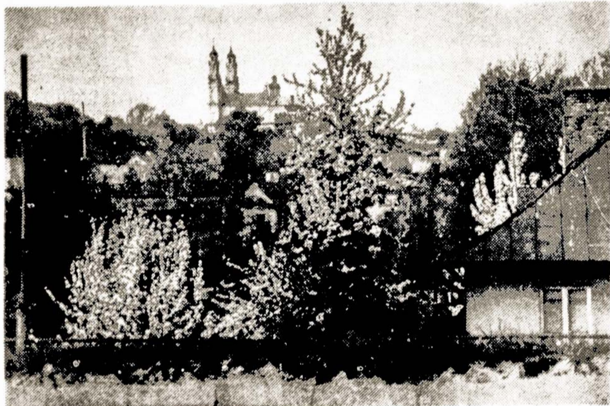
Nuotraukoje: Vilniaus apylinkių vaizdas pavasarį.