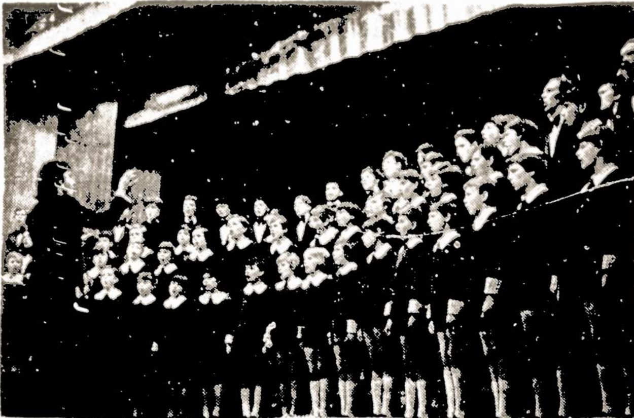
Nuotraukoje: Dainuoja "Ąžuoliuko" choras.