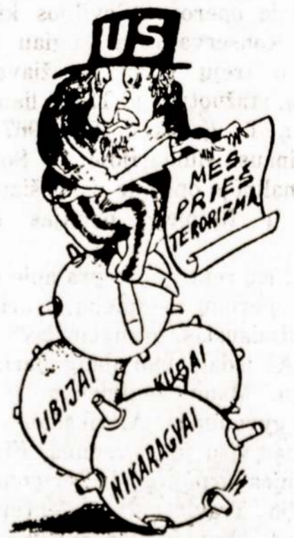
Leonido Vorobjovo pieš.

9,1 procento padaugėjo amerikiečių, vyresnių negu 85 metų. Dabar šiai amžiaus grupei priklauso 2,4 milijono žmonių, tarp jų 32 tūkstančiai yra sulaukę nemažiau kaip 100 metų. Trys ketvirtadaliai ilgaamžių virš 100 metų — moterys.