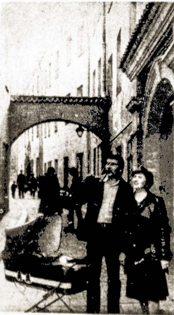
Vilniaus senamiesčio gatvelė.

Sniečkaus ir "Rytų aušros", Panevėžio rajono Eriškių, Kapsuko rajono Želsvelės ir kai kuriuose kituose nudrenuoti, sukultūrinti visi laukai, o žemdirbiai iš vienkiamų persikėlė į gražias ir patogias gyvenvietes.