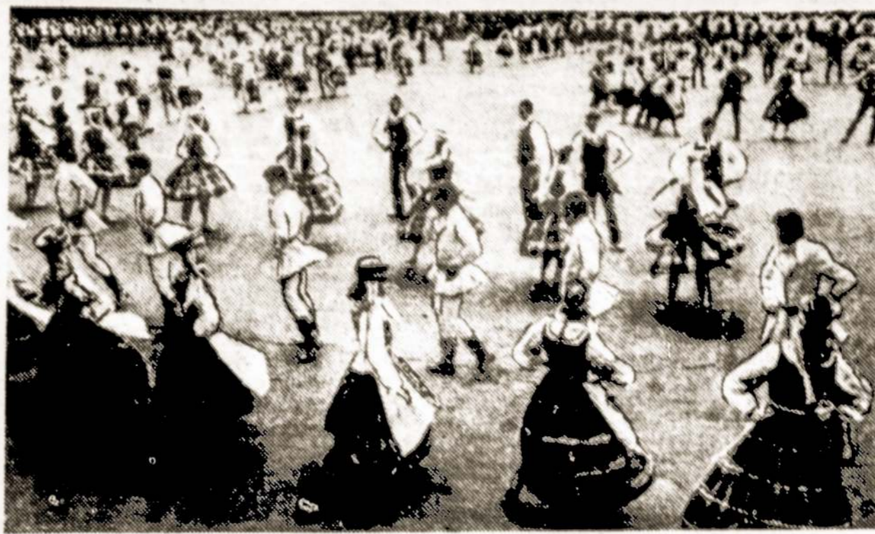
Nuotraukoje: Soka Lietuvos studentai.