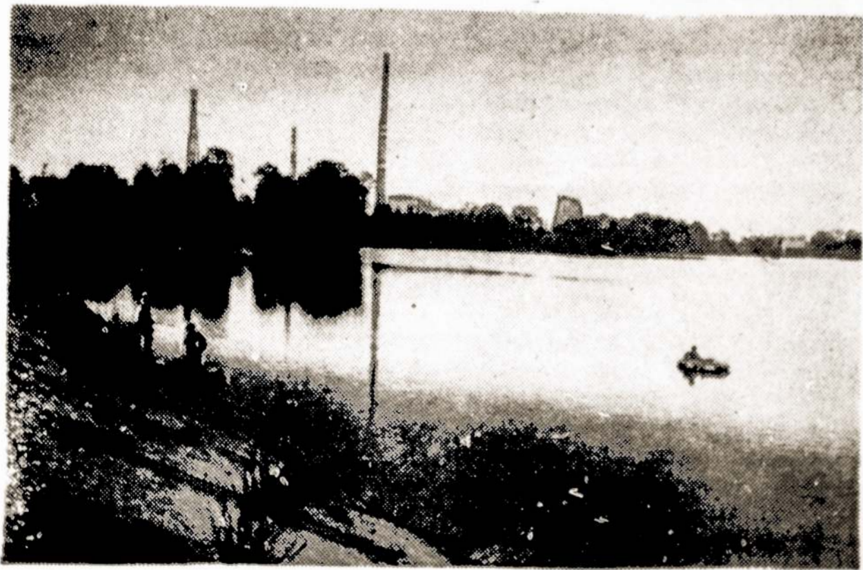
Nuotraukoje: Užtvenkta Varduvės upė tiekia Naftos gamyklai vandenį. Čia visuomet pamatysi ir mėgėjų pažvejoti.

Be abejo, pastebėsite, jog amerikanistinę literatūrą leidžia visa eilė leidyklų. Tad tarybiniais žmonėms, kurie domisi Amerika ir amerikiečiais, yra ką skaityti, kaip sakoma, tik spėk. Suprantama, ši literatūra turėtų būti žinoma ir tiems amerikiečiams, kuriems rūpi, kaip jų gyvenimas suvokiamas socialistiniame pasaulyje. Vitnietis