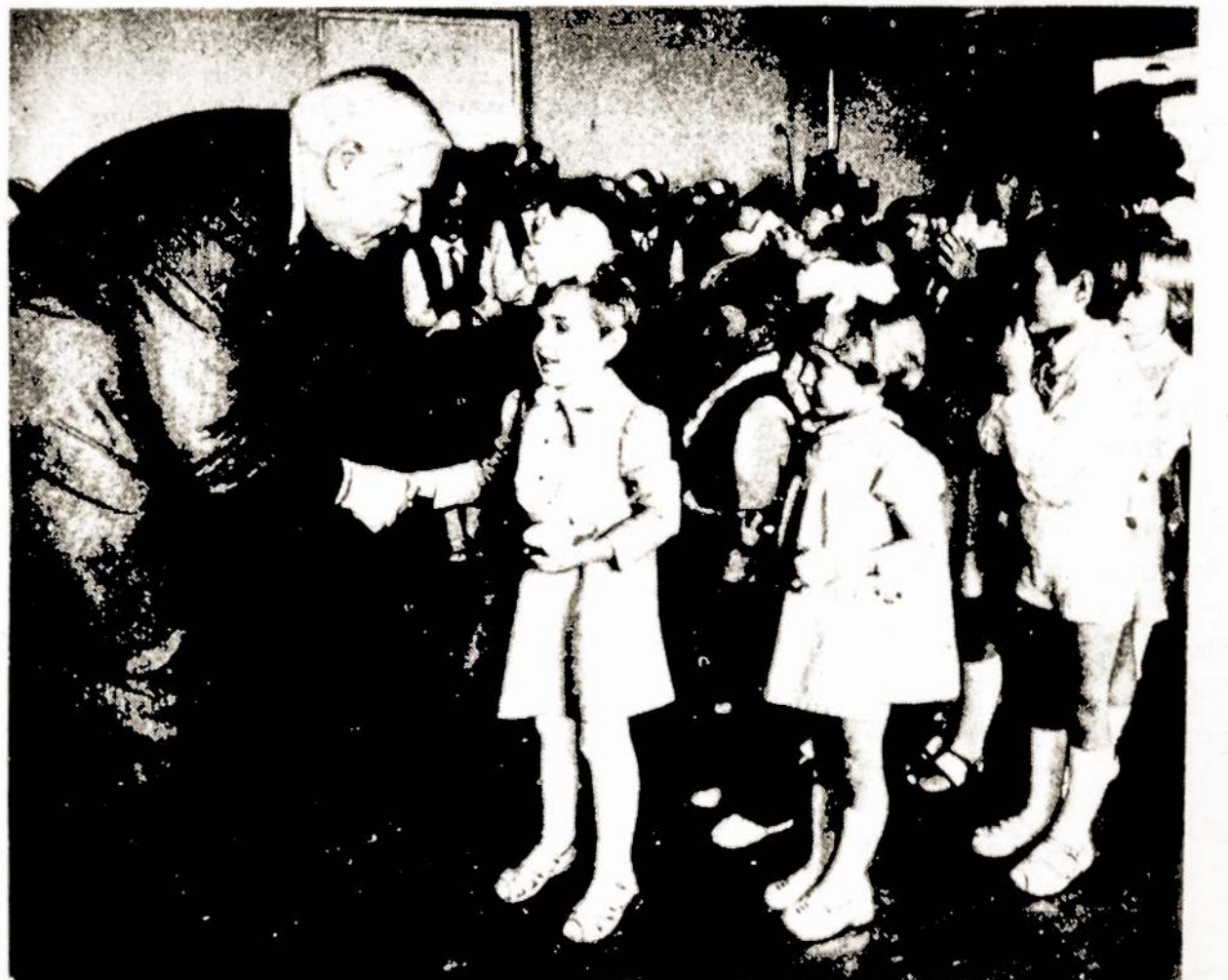
Vaikų darželio atidarymo šventė Pasvalio rajono "Raudonosios Zvaigždės" kolūkyje. Vaikučius sveikina Lietuvos KP Centro Komiteto pirmasis sekretorius Petras Griškevičius.