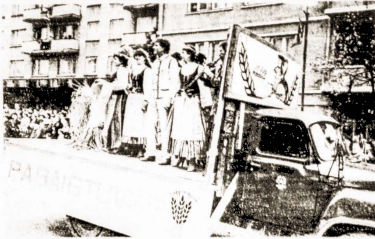
Sventė, skirta išvadavimo 40-mečiui, uztvindė Telsių centrinę gatvę.