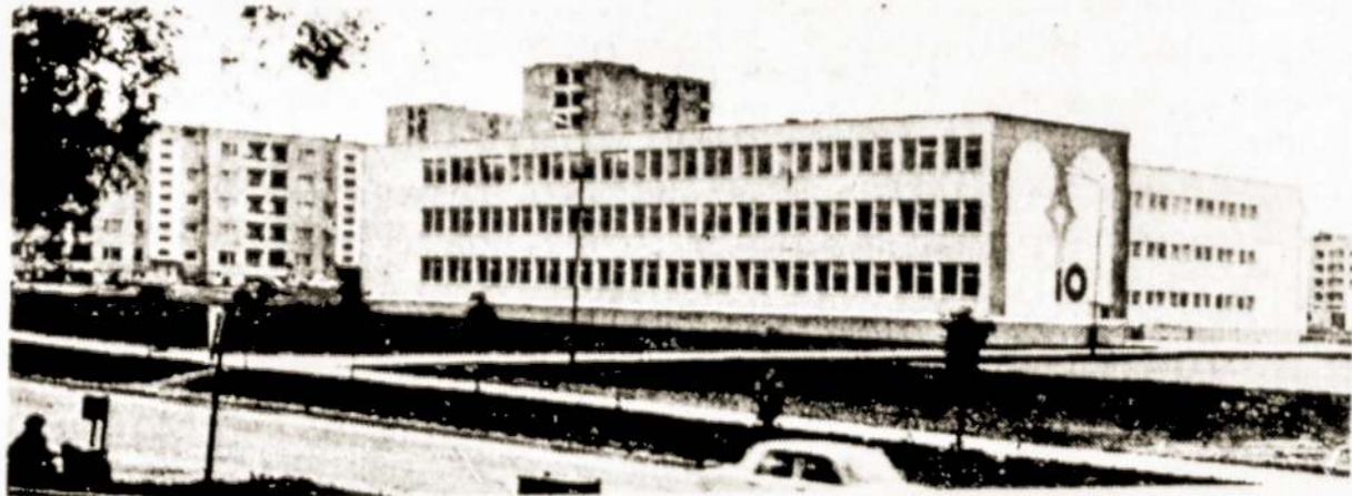
Naujos 10-osios vidurinės mokyklos Vidzgirio mikrorajone bendras vaizdas.

Alytaus naujajame Vidzgirio mikrorajone šiemet atvėrė duris 10-oji vidurinė mokykla. Rugsėjo pirmąją ją susirinko daugiau kaip tūkstantis šimtas jaunųjų alytiškių. Ypač gausus pradinukų būrys.