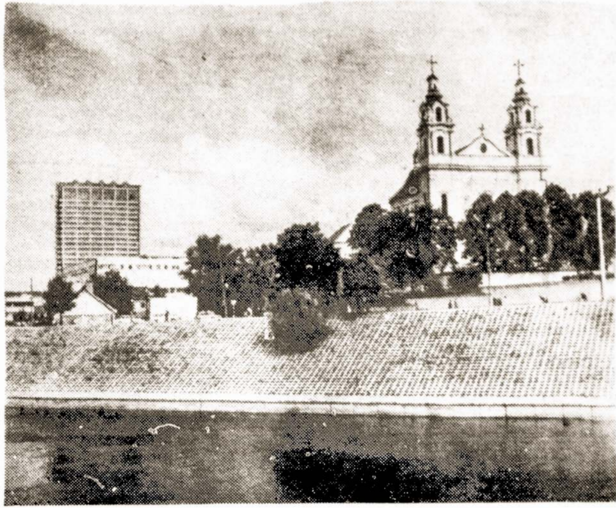
Lietuvių architektų pastangomis naujoviški pastatai Vilniuje gražiai priderinami prie senosios architektūros paminklų.

Nuotraukoje: Moderniškas "Lietuvos" viešbutis greta šv. Rapolo bažnyčios.