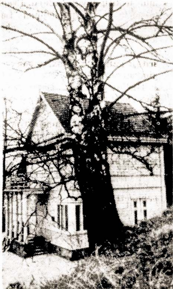
J. Gruodžio memorialinis muziejus.

tais laikraščiuose išspausdintų jo straipsnių fotokopijos. J. Gruodis rašė, kad naujoji valdžia atvėrė kelius lietuvių kultūros sparčiam vystymui ir suklestėjimui. Atskiras ekspozicijos skyrius pasakoja, kaip Tarybų Lietuvoje saugomas kompozitoriaus atminimas. Čia jo kūriniai išspausdinti Vilniuje ir Maskvoje, studijos apie jo gyvenimą ir kūrybą, nuotraukos apie Kauno aukštesniosios Juozo Gruodžio muzikos mokyklos veiklą.