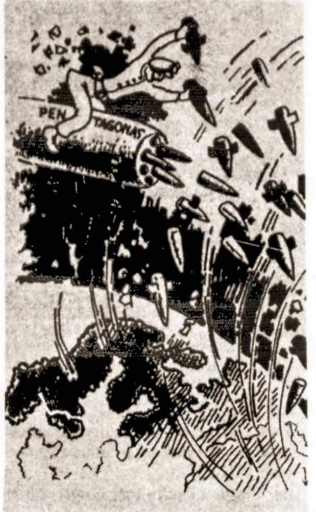
Pentagono užmačios. TSRS liaudies dailininko V. Jurkno pieš.

Neseniai Tarybų Sąjungos inicia-tyva Juntinių Tautų Generalinės Asamblėjos sesija apsvaustė klau-simą "Dėl kosminės erdvės naudojimo tik taikiems tikslams, žmonijs labui". Generalinės Asamblėjos rezoliucijai pritarė 150 balsų. Pažy-mėtina, kad šio nutarimo, kuris buvo pakelbtas spaudoje, neparė-mė tik Jungtinės Valstijos. Tai dar kartą patvirtina, kad Washingto-nas siekia militarizuoti kosmosą.