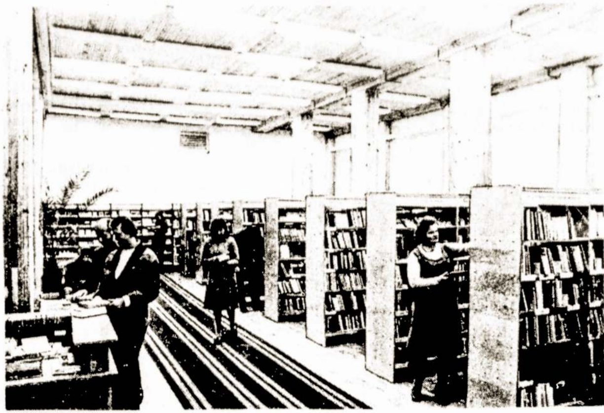
Abonemento salėje erdvi ir knygoms, ir skaitytojams.