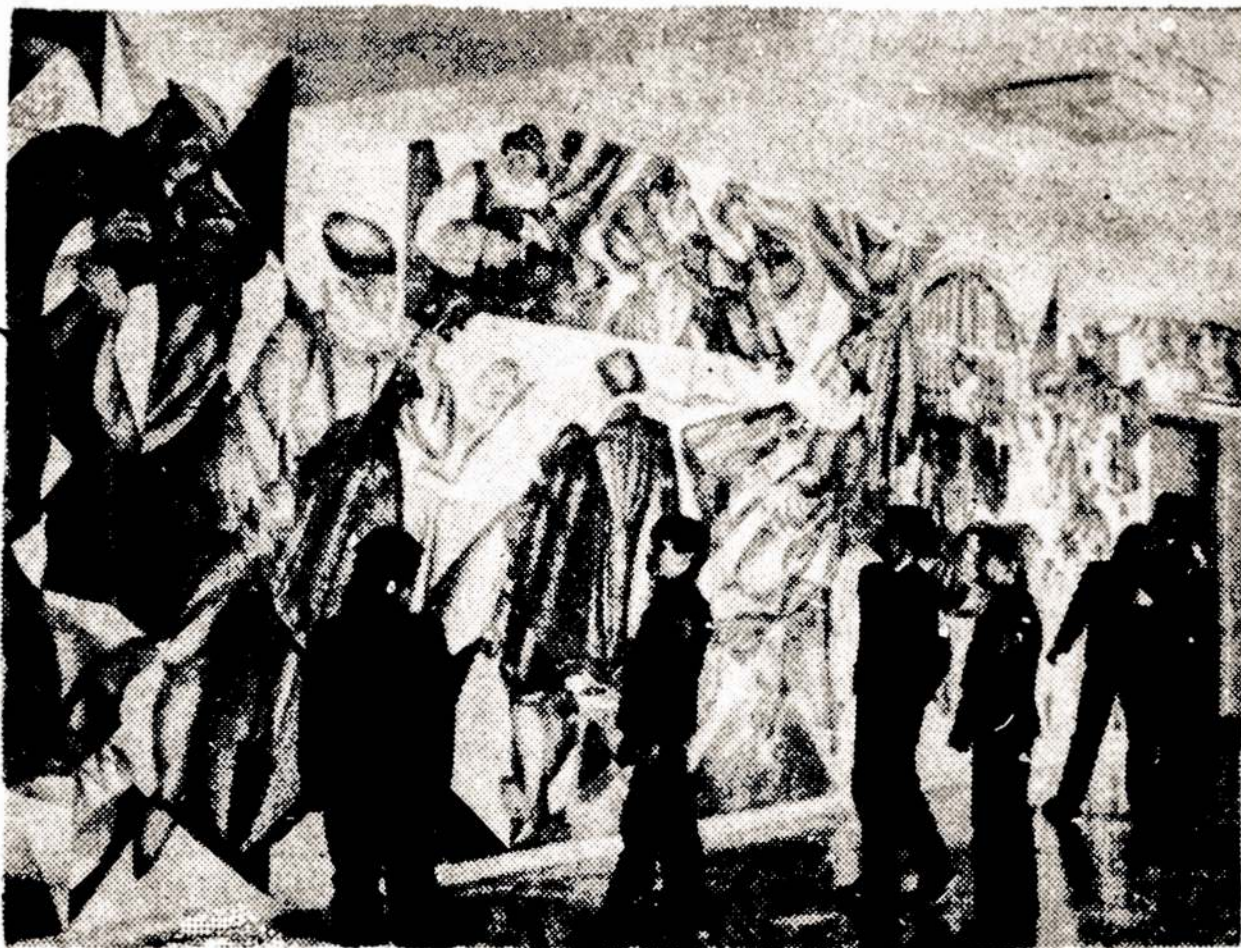
Rekonstruotose, vietos dailininkų skulptūromis, freskomis ir vitražais papuoštose patalpose įsikūrė Klaipėdos vidurinė internatinė meno mokykla. Bendrų dalykų ir muzikos joje mokosi 150 vaikų iš Klaipėdos ir aplinkinių žemaitijos rajonų.

Dainų šventės — nelyginant ašis, apie kurią sukasi respublikos meno saviveiklos judėjimas. Pakeliui į jas atsiskleidžia ir subręsta talentai. Jose greta suaugusiųjų labai gausiai dalyvauja vaikai, mokyklinis jaunimas — krašto ateitis. E.