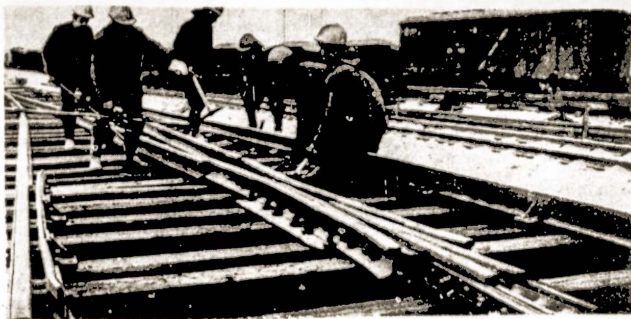
Šiais mėnesiais į perkėlos uostą riedės traukiniai.

Kuršmarių pakrastyje, ties Vakarų laivų remonto įmonės akvatorija, gaudžia žemkasės, betonuojamos krantinės, klojami pamatai administraciniams pastatams. Sparčiais tempais kyla naujas Klaipėdos uostas. 1986 metų pabaigoje jame jau švartuos iš Rytų Vokietijos atplaukę jūrų keliai.