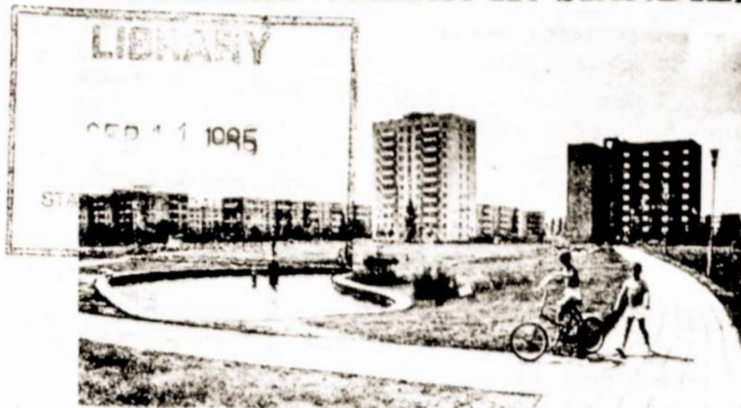
Naujųjų Mažeikių kvartale.

1939 metais savitraštis "Verslas" vieną numerį paskyrė Mažeikiams. Rašyta štai apie kokią pramonę: bravorą, baldų, skardos, saldainių, vaisvandenių dirbtuves.