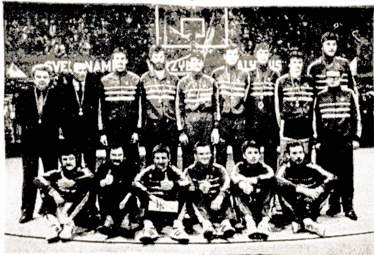
NUOTRAUKOJE: Kauno "Žalgirio" komandos krepšininkai.

Jeigu Lietuvoje kada nors bus pastatytas paminklas sportui, tai svarbiausia figūra jame, be abejo, turėtų būti krepšininkas. Niekas taip neišgarsino Lietuvos sporto, kaip jie, krepšininkai ir krepšininės, ir nėra respublikoje populiariausios sporto šakos už šį žaidimą.