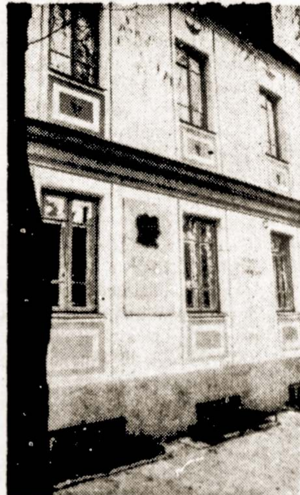
Nuotraukoje: TSRS liaudies artisto Kipro Petrausko memorialinis muziejus.

Mieste prie Nemuno Kipras Petrauskas sukūrė reikšmingiausias savo vaidmenis — Germaną P. Čaikovskio "Pikų damoje", Rada-