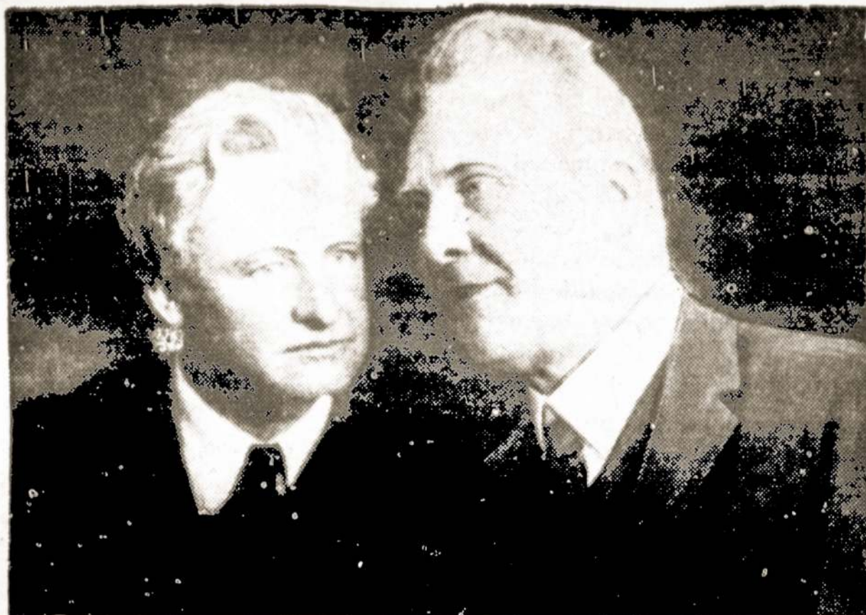
Nuotraukoje: Kipras Petrauskas (kairėje) su pasaulinio garso solistu Fiodoru Šaliapinu.