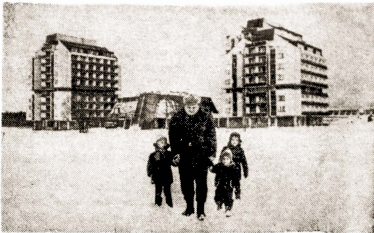
Ziemą Palangoje prie žemdirbių sveikatingumo miestelio.