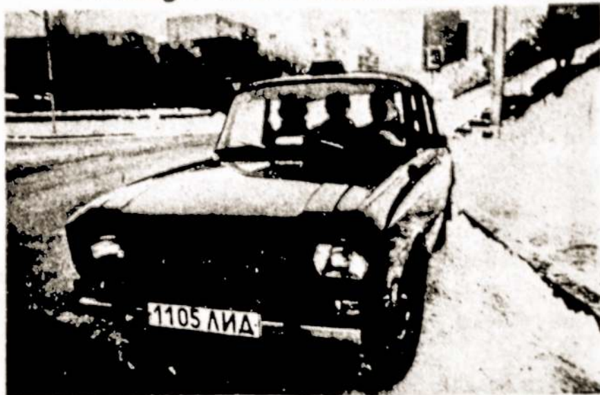
E. Reklaičio nuotraukoje: naujasis taksi "Moskvic-2140".

Naujųjų 1986 metų išvakarėse Lietuvos miestuose pasirodė nauji automobiliai su juodų ir baltų langelių juoste virš stogo. Tai jau žinomos Maskvos Lenino komjaunimo automobilių gamyklos mašinos "Moskvic-2140".