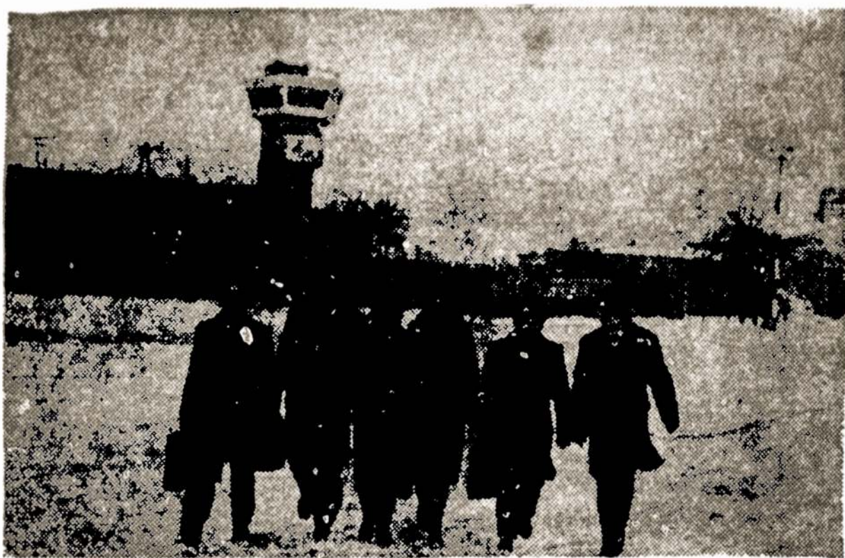
Nuotraukoje: grupė vilniečių aviatorių.

Dešimtys plieno paukščių kasdien sulekia į Vilniaus aerouostą žydrosiomis padangių trasomis. Jeigu sudėtume tuos kelius į vieną tiesiąją, ja keletą kartų galėtume apjuosti žemės rutulį.