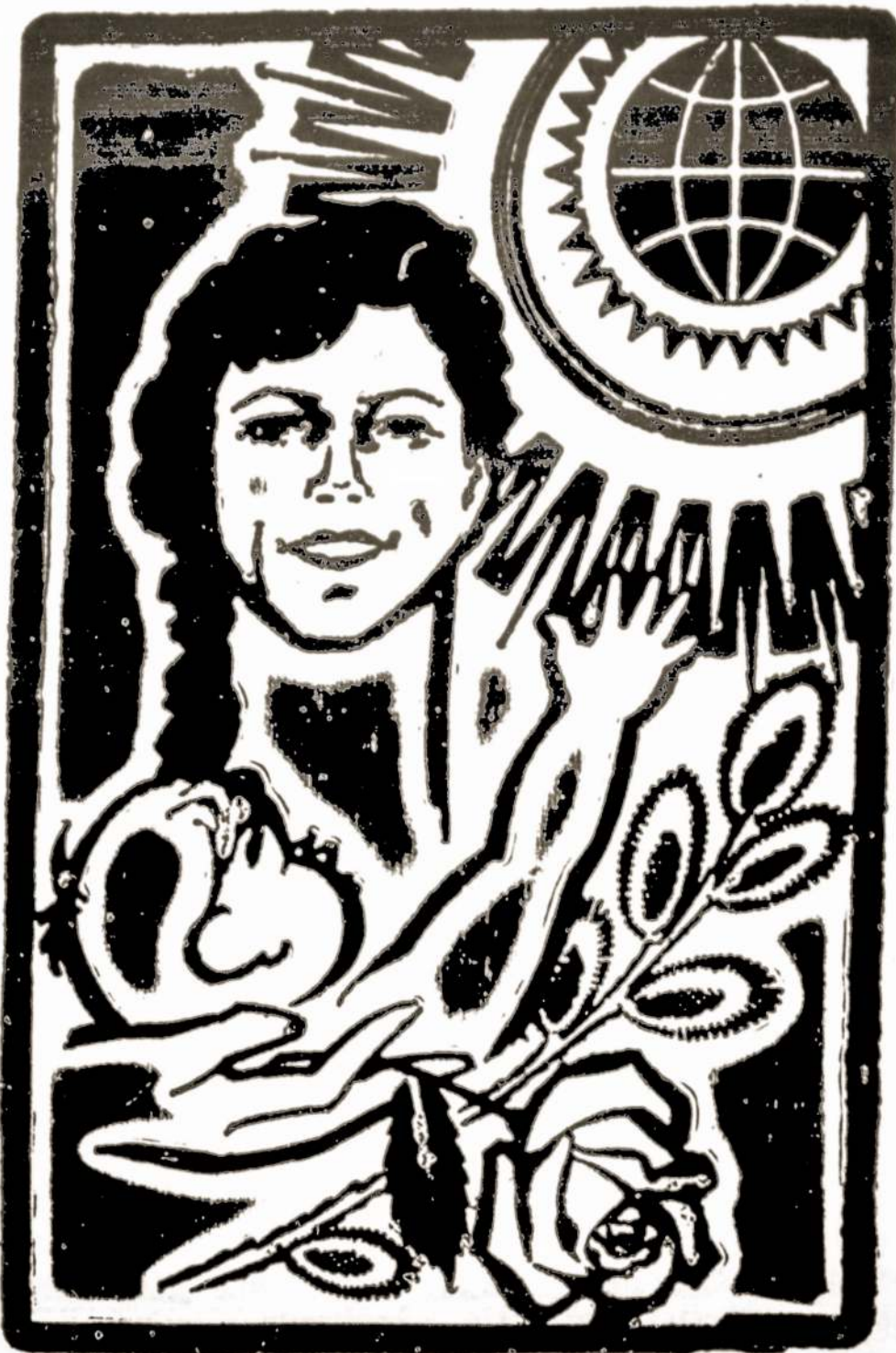
Kovo 8-oji — Tarptautinė Moters diena (J. Buivydo plakatas)

Toliau Gorbačiovas senatoriui pažymėjęs: jeigu po susitarimų Ženevoje nebus padaryta pažangos