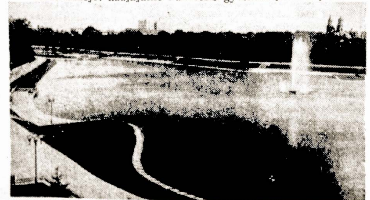
Nuotraukoje: mėgstama panevėžiečių poilsio vieta.