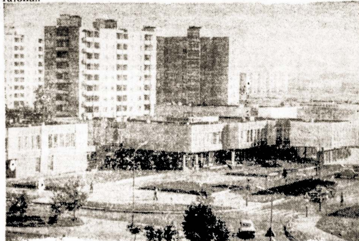
Nuotraukoje: naujajame Panevėžio gyvenamajame rajone.

Šiandieninis Panevėžys — stambus Aukštaitijos pramonės centras. Jame išaugo naujos pramonės įmonės, pastatyti nauji gyvenamųjų namų kvartalai. Panevėžiečiai daug dėmesio skiria miesto tvarkymui. Neatpažįstamai pasikeitė miesto centras, pagražėjo nauji gyvenamieji rajonai.