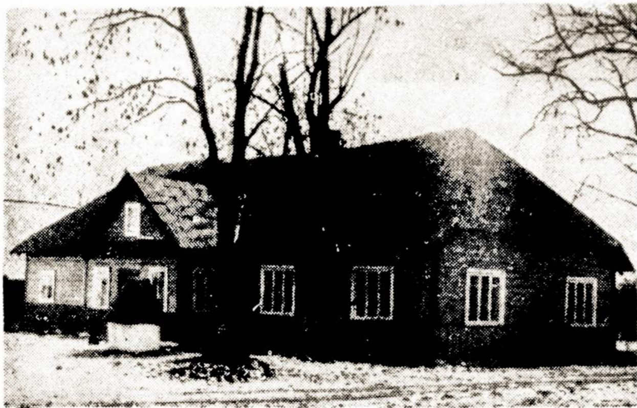
poeto Antano Vienažindžio memorialinis muziejus Juodelių sodyboje Gipėnų kaime.

Retas Rytų Aukštaitijos žmogus turbūt nežino, kad dabartinio Zarasų rajono Gipėnų kaime, prie melynųjų Sartų, prabėgo poeto Antano Vienažindžio (1841-1892) vaikystė, kad čia jo išvaikščioti takai takeliai, sukurtos dainos, plačiai pasklidusios po visą Lietuvą.