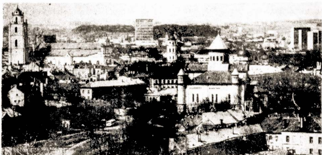
Vilniaus senamiestis nuo barbakano.

Jaunųjų susivienijimas, veikiantis prie Lietuvos TSR dailininkų sąjungos, turi beveik 300 narių. Tai Tarybų Lietuvos vaizduojamosios ir taikomosios dailės ateitis. L.