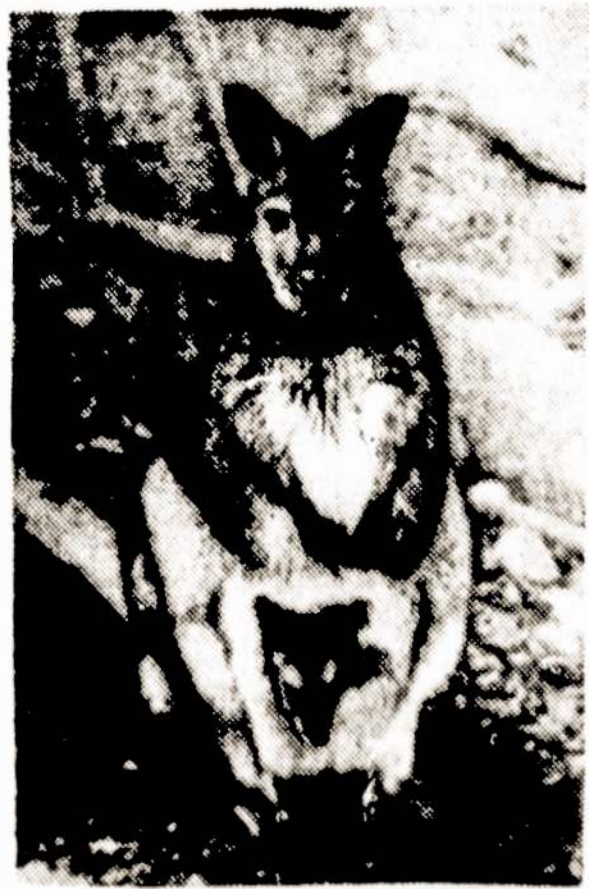
Kauno zoologijos sodas yra vienas iš nedaugelio pasaulyje, kur nelaisvės sąlygomis veisiasi įvairūs žvėrys ir paukščiai.

Kai batsiuovys siuva batą, turi pats vienas atlikti daug darbo operacijų kol batą pasiuva. Taip esti, kai šeimos gydytojas tikrina savo paciento sveikatą — turi atlikti įvairių tyrimų kol nustato ligos diagnozę. Batų dirbtuvėje batus gamina konvejeriniu būdu. Konvejerijoje atliekamos viso darbo operacijos viena po kitos tiksliai ir greitai, batai nuo konvejerio vienas po kito tik eina ir eina. Taip tikrinama paciento sveikata Mayo klinikoje. Pradedama paciento ūgio ir svorio matavimu, paskui eina prie kraujo patikrinimo į atskirą klinikos skyrių, į kvėpavimo organų patikrinimo atskirus skyrius, į raumenų, ir taip iš skyriaus į