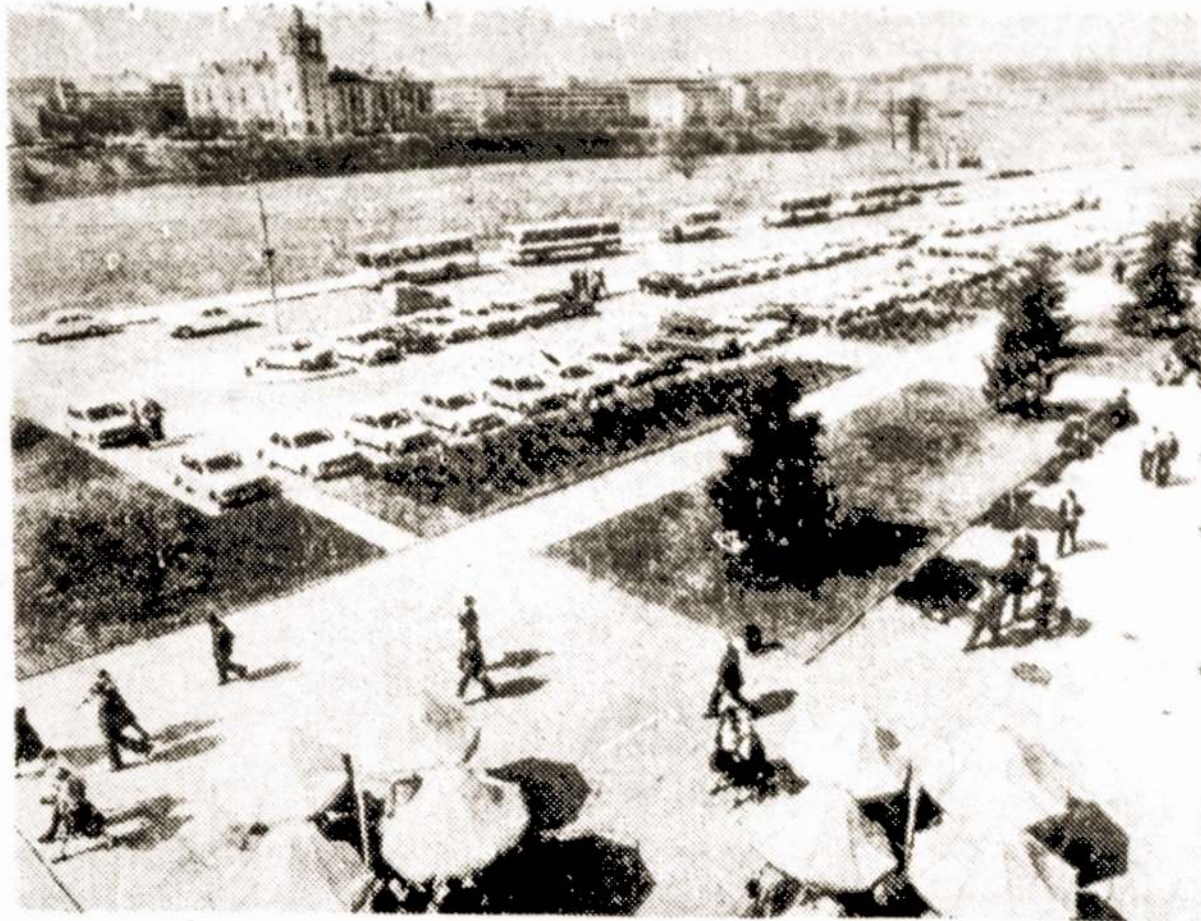
Nuotraukose: Vilnius pavasarį; senamiesčio kampelis.